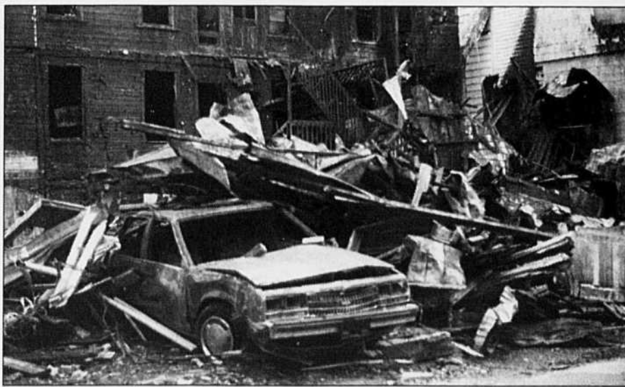
Au milieu des décombres d'un incendie survenu à la mi-juin à Shawinigan, on voyait encore cette voiture la semaine dernière.