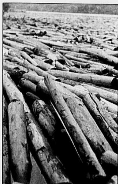
Le bois flotte toujours sur la rivière Saint-Maurice. Stone-Consolidated y entasse des tonnes de billots de bois.

Agenda culturel Page B7 Culture Page B8 Le Monde Page B3 Sports Page B6