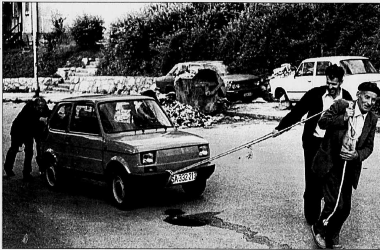
Autre conséquence de la guerre: le pétrole hors de prix à Sarajevo