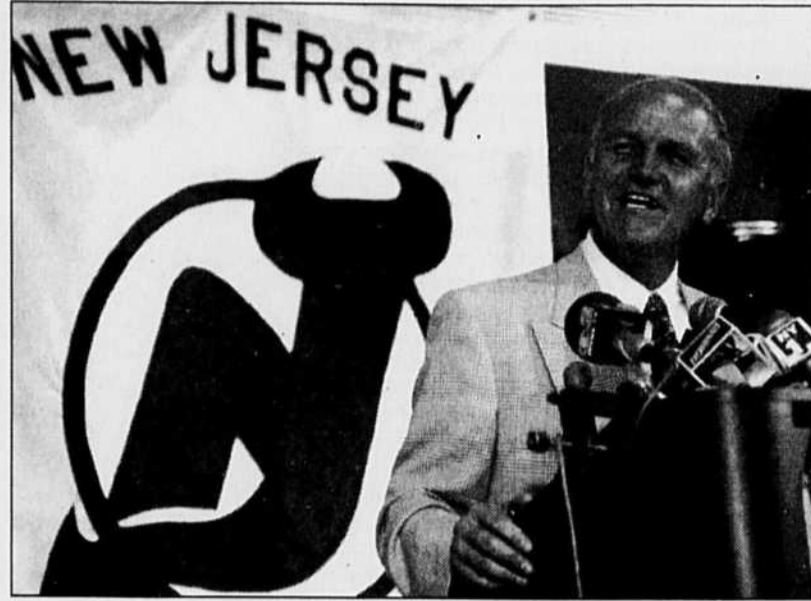
«Les partisans des Devils verront des efforts d'équipe et du dynamisme dès la saison prochaine», a promis le nouvel entraîneur Jacques Lemaire.

«Nous sommes bien nantis devant le filet et nos défenseurs valent bien ceux de n'importe quelle autre équipe de la LNH. J'étais désappointé. Cette équipe était l'une de mes favo-