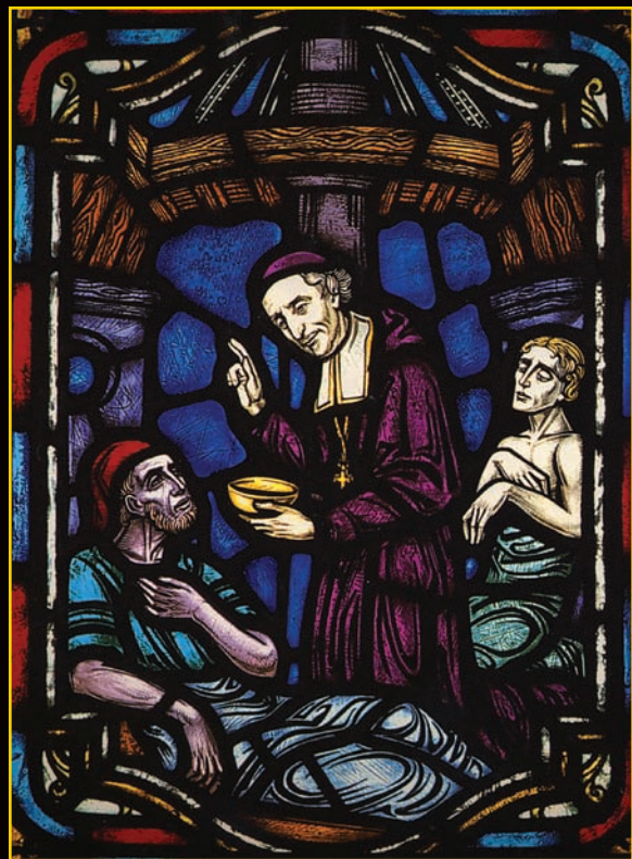
Bienheureux François de Laval premier évêque de Québec 1623-1708