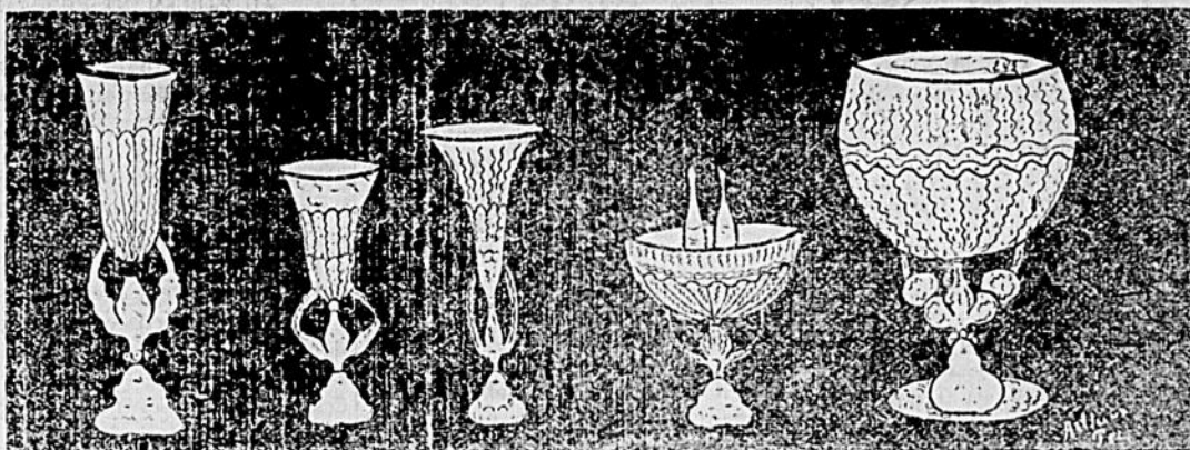
Vous vous imaginez, sans doute, que ces dessins représentent des verres et des coupes; tournez-les à l'envers et vous verrez que vous vous trompez.

La célèbre pièce de "La Passion," qui a été jouée par la troupe de M. Daoust, au Monument National, toute la semaine passée, devant un auditoire nombreux, sera représentée cette semaine, vu qu'un grand nombre de personnes n'ont pu y assister. De fait, on a refusé du monde à chaque représentation. Et un grand nombre de billets sont vendus d'avance pour cette semaine. Malgré l'affluence considérable, la direction n'augmentera pas le prix des places, qui sont à la portée de toutes les bourses. La pièce est bien montée, les rôles sont surs et rendus à la perfection. C'est là le secret du succès de "La Passion."