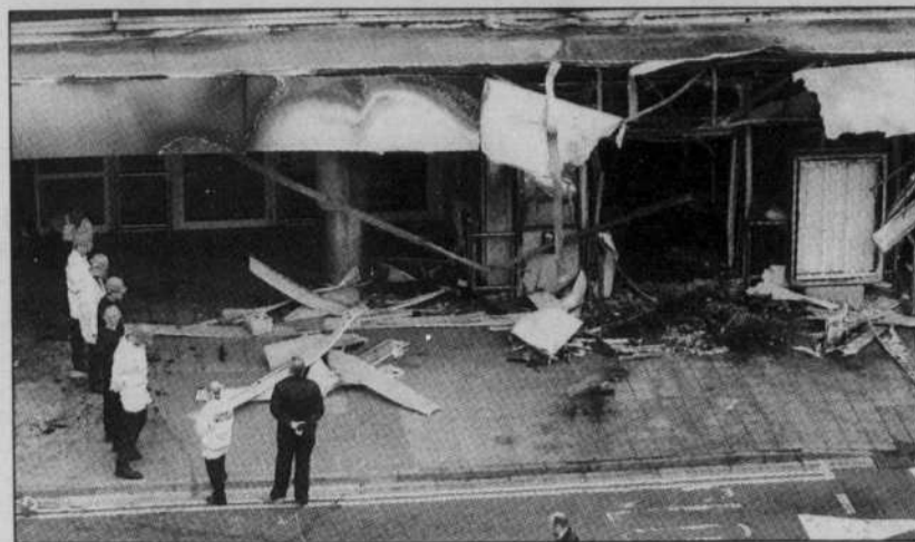
Des enquêteurs sur les lieux de l'attentat commis à l'aéroport de Glasgow.