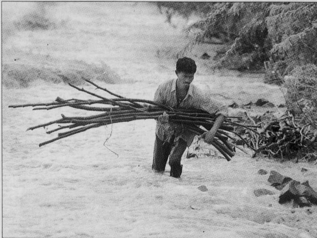
Un homme transporte des fagots dans les rues inondées de Dhadhuka, dans la province indienne du Gujarat. En Inde, environ 240 personnes ont été tuées par les inondations au cours des dix derniers jours. Au Pakistan et en Afghanistan, plusieurs centaines de personnes ont également péri depuis le début de la mousson.