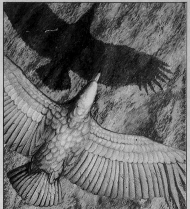
L'argentavis magnificens, qui avait à peu près les dimensions d'un Cessna 152, sillonnait le ciel d'Argentine il y a six millions d'années.