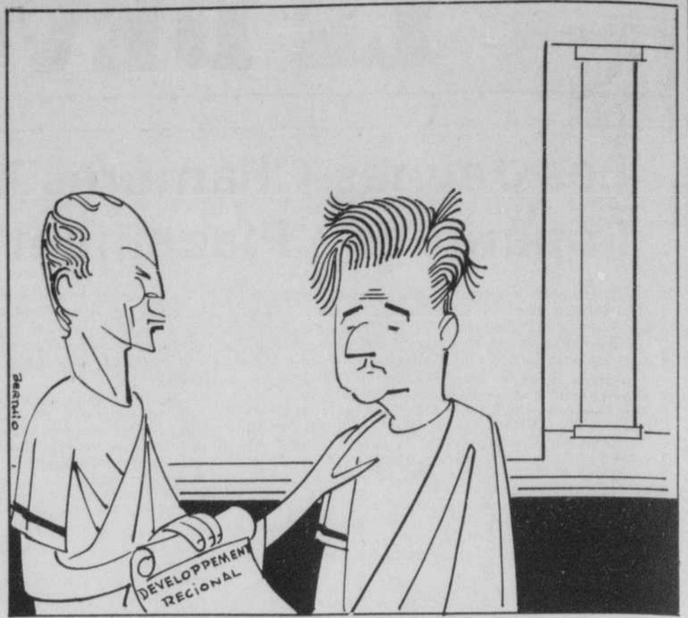
Marchand-toine, je te confie mes régions romaines