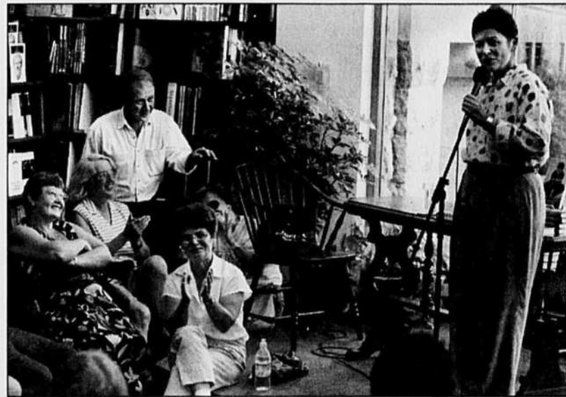
Kate Clinton, animatrice de Queer Comics et auteure de Don't Get Me Started , a participé à une séance de signature, hier après-midi, à la librairie Paragraphe.

Kate Clinton, surnommée «Madame President of Comedy» en dépit de l'absence de parenté génétique et spirituelle qui l'unit au résident de la Maison Blanche, jouait les maîtres de cérémonie avec un aplomb et une éloquence qui, d'entrée de jeu, attestaient du professionnalisme du spectacle qu'elle présentait. Un spectacle que cette ancienne institutrice et nouvellement écrivaine (elle est l'auteur de Don't Get Me Started , sorti au printemps) a ouvert par un monologue railleur et courtois sur la récente persécution des homosexuels américains, redevenus la cible d'un lobby composé de prédicateurs acharnés (Pat Robinson, l'Église baptiste du Sud, etc.) et de joueurs de football bigots (Reggie White) enflammés par la sortie du placard, à la ville et à la télé, de la comédienne Ellen De Generes. Venin pour venin, celui craché par Clinton a fait au moins autant de victimes, et semé l'hilarité au passage. Une expérience