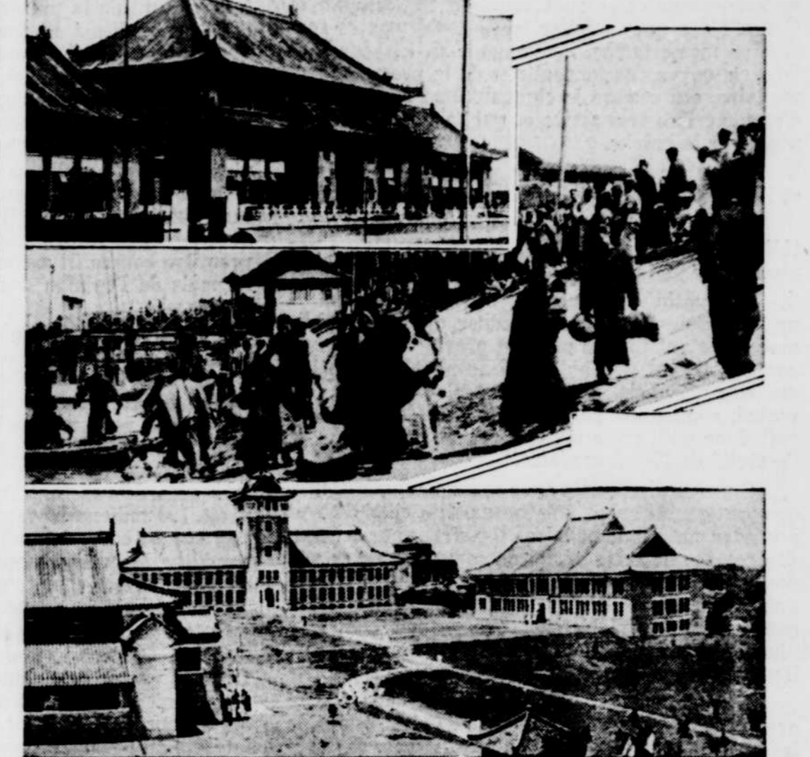
Comme dans toute guerre moderne, l'aviation joue un rôle capital dans le présent conflit sino-japonais, et Nankin, la capitale de la Chine, craint, tout particulièrement, que les avions japonais n'y viennent semer la mort et la destruction. Aussi, une partie de la population s'est-elle empressée de fuir. Dans le haut, on voit un édifice du ministère des chemins de fer; dans le centre, une photo prise durant une fuite des gens, et, en bas, une partie de la ville de Nankin.