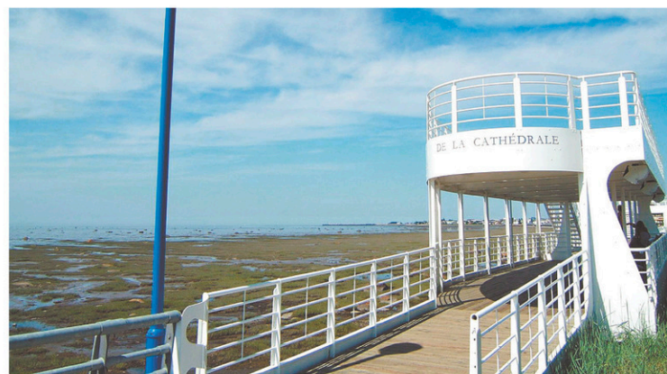
L'UQAR propose des écoles d'été en océanographie et en géographie.