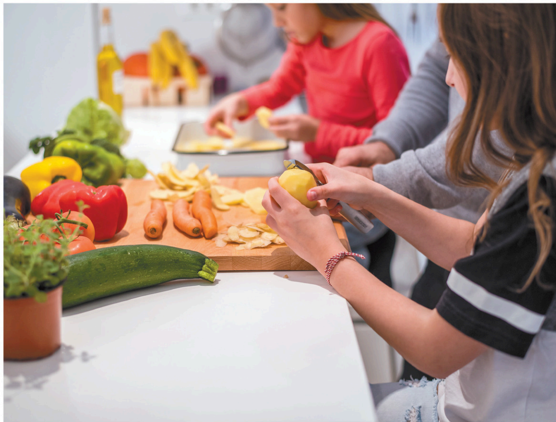
La cuisine végétarienne sera aussi en vedette une journée.

C'est la même chose avec les pâtes fraîches, qui seront préparées pour la lasagne mais qui pourront être faites dans différentes formes par la suite. Les jeunes apprendront