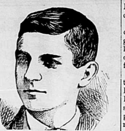
Frank Lake Oshawa, Ont.

Sûres, efficaces, faciles. — HOOD'S PILLS.—25 cts.