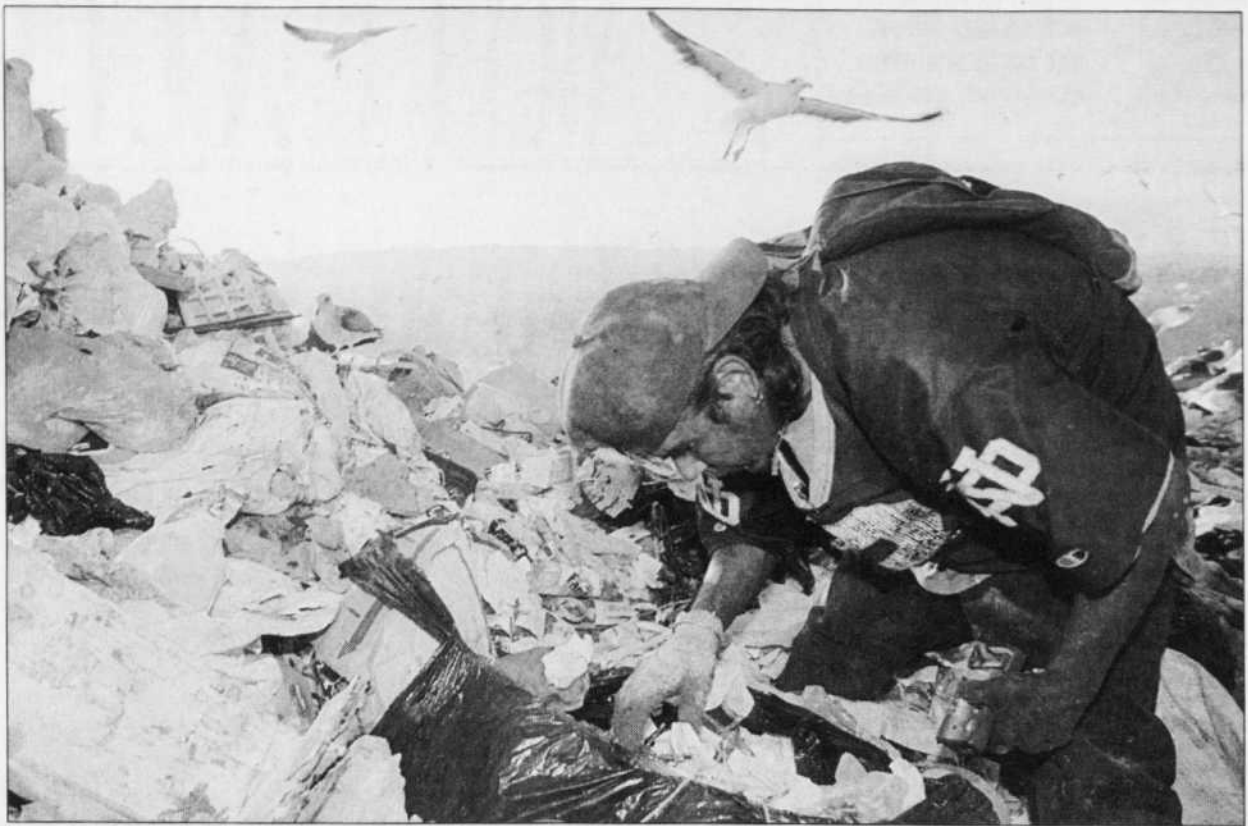
Au Mexique, comme ailleurs dans le monde, nombre de personnes doivent fouiller dans les déchets pour survivre.

La chose a toutefois eu des conséquences sur son ministre, qui a dû comparaître devant un comité pour dire exactement à quel moment il avait été informé et expliquer pourquoi il avait fourni deux versions des faits à la Chambre des communes.