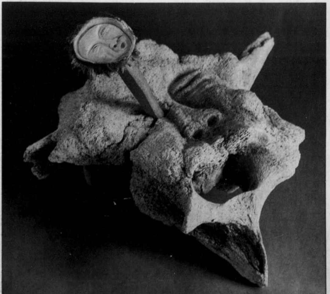
MUSÉE NATIONAL DES BEAUX-ARTS DU QUÉBEC

Raymond Brousseau a vendu une partie de son imposante collection à Hydro-Québec pour la somme de 2,9 millions de dollars. Il a donné l'autre partie au Musée national des beaux-arts. Pour le musée, les 2635 pièces de cette collection constituent la plus importante acquisition du musée depuis 1933 et sont