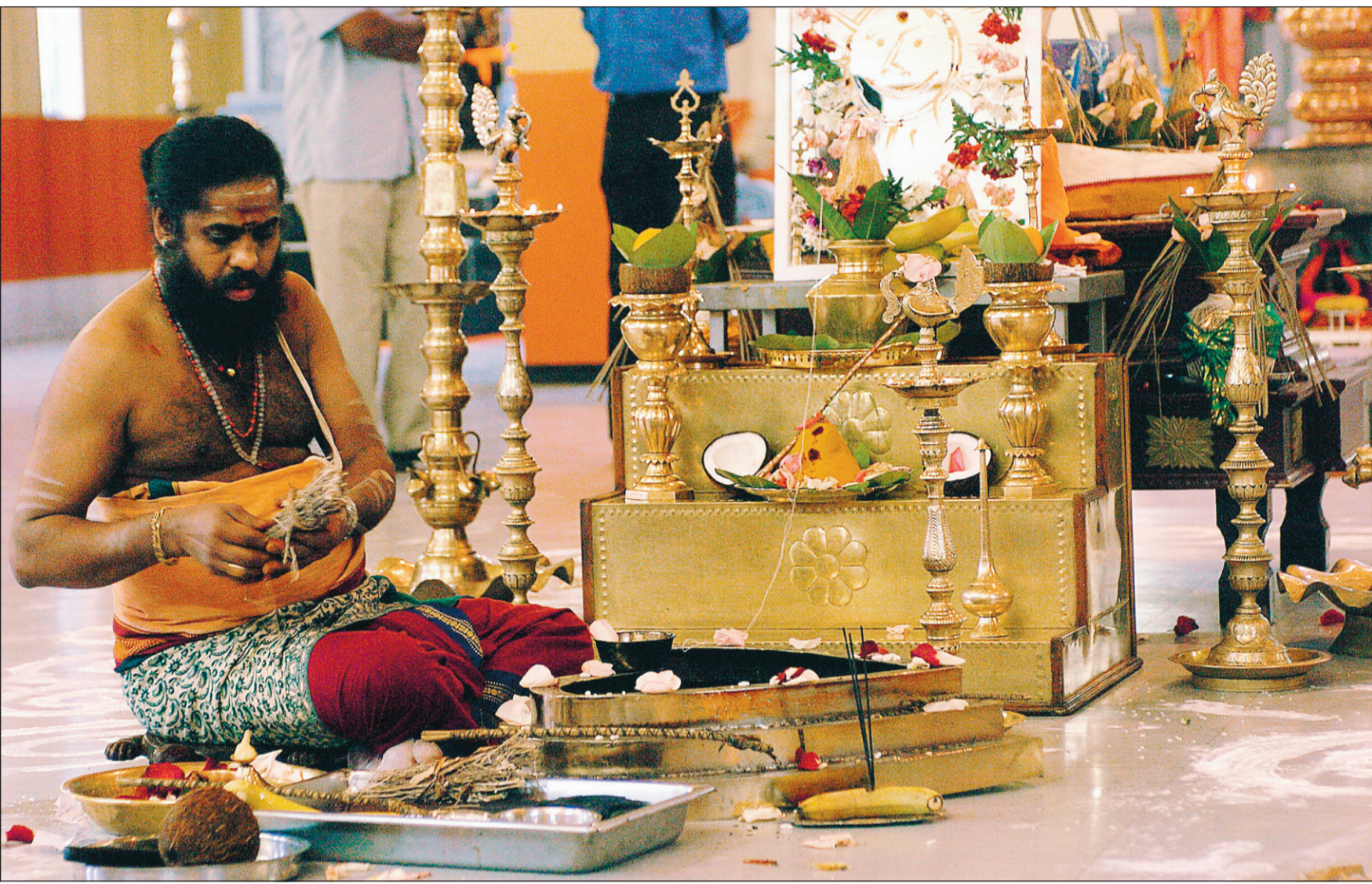
La cérémonie du Thai Pongal, fête des moissons, au temple Durkai Amman, rue Jean-Talon, à Montréal.

MÉDIAS : UN NOUVEAU MAGAZINE QUÉBÉCOIS SUR LE HIP-HOP PAGE 5