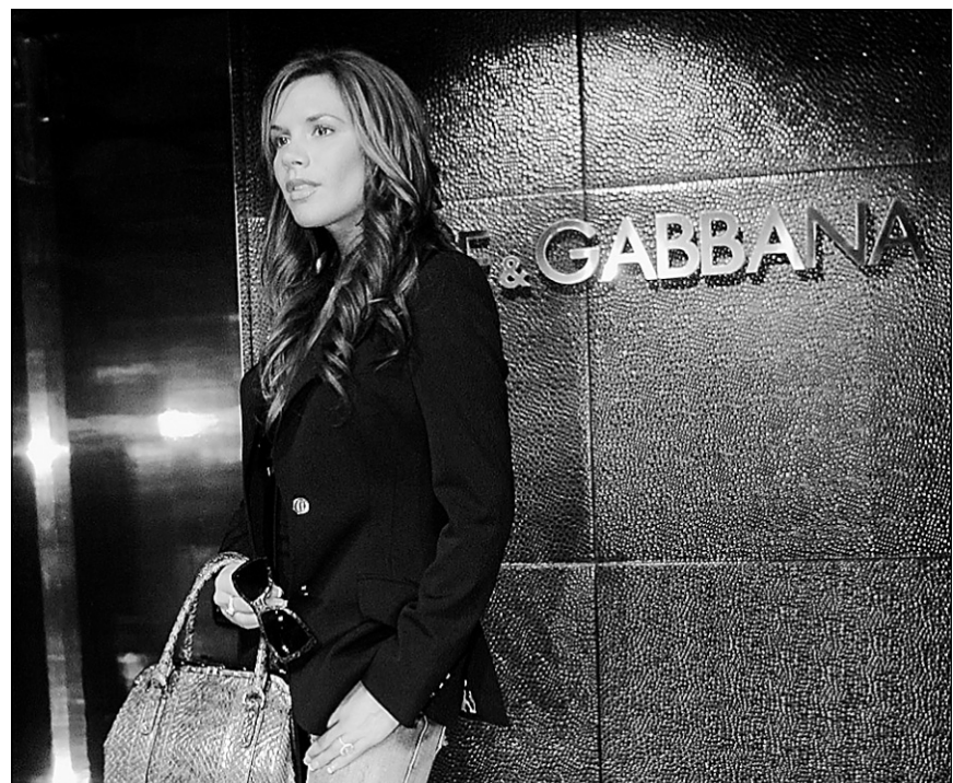
Victoria Beckham est totalement « chav », parce qu'elle est obsédée par les marques et le shopping et qu'elle passe son temps dans les salons de beauté pour parfaire son bronzage et ses ongles manucurés.