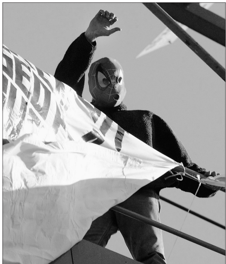
Un groupe de défense des droits des pères établi en Grande-Bretagne, Fathers 4 Justice, suggère souvent à ses membres de faire des coups d'éclat en se déguisant en superhéros de bande-dessinée comme Batman, Superman ou Spider-Man.

Le nombre d'injonctions visant les mères résistant au droit de visite du père a augmenté de 100 % depuis 1993. Mais celles-ci sont encore peu suivies d'effet. En 2001, plus de la moitié des 55 030 injonctions judiciaires de ce type auraient été purement et simplement ignorées.