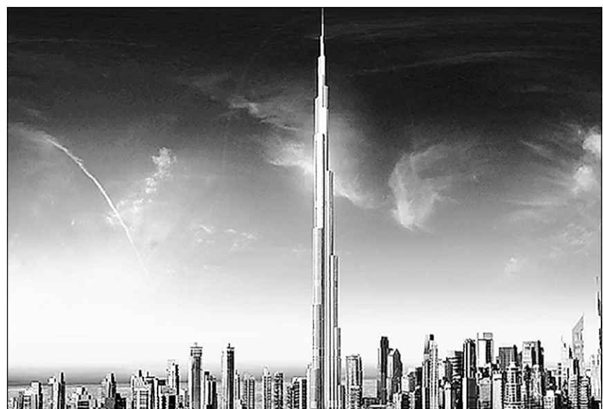
Quand il sera terminé, en novembre 2008, le Burj Dubai, dont on voit ici une illustration, sera l'édifice le plus haut du monde. Il atteindra près de 800 mètres de hauteur et comportera 160 étages. C'est un consortium à la tête duquel on retrouve la multinationale coréenne Samsung qui a obtenu le contrat de construction de quelque 850 millions.

Visionnaire, l'émir al-Maktoum ? Poète, en tout cas : dans les Émirats, il est considéré comme un des principaux représentants contemporains de la poésie nabati — un genre littéraire spécifique aux Bédouins. « La poésie a contribué à l'évolution des Émirats », aime-t-il déclarer lorsqu'on met le sujet sur la table. Ce qui n'enlève rien aux mérites du pétrole, naturellement, ni à ceux du développement touristique.