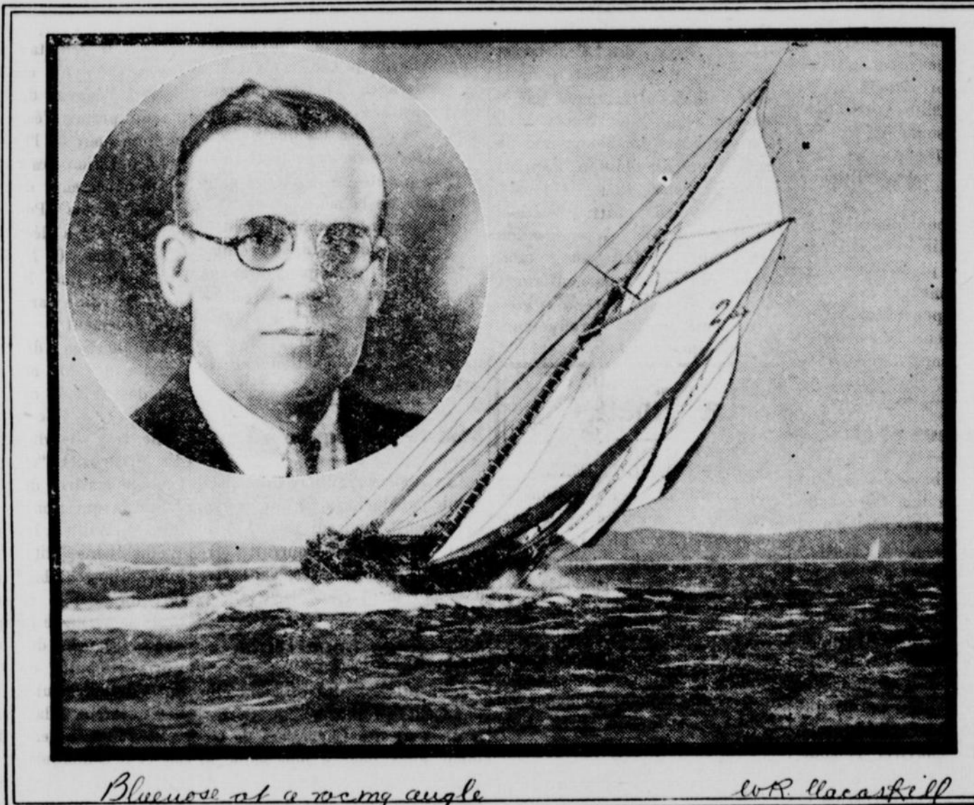
Bluenose et à 90° angle