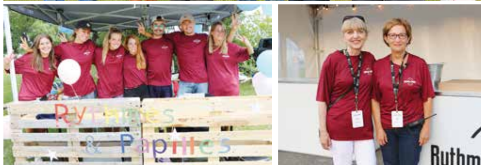
Une partie des bénévoles qui semblent heureux d'apporter leur contribution à la fête.

Pour vos communiqués : cassista@videotron.ca ou 418 575-4539