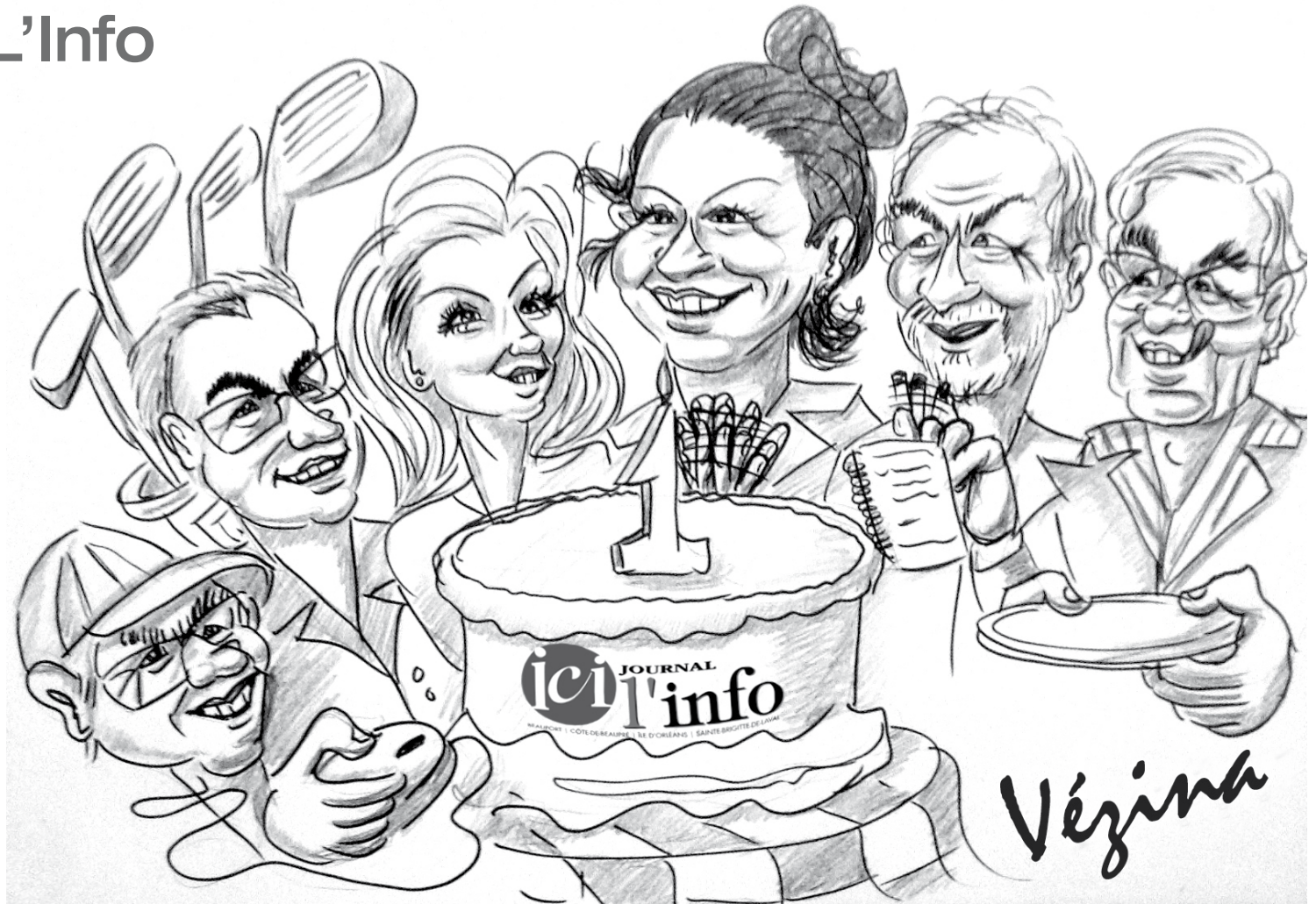
(Illustration : Denis Vézina, www.vezinacaricatures.com )

« J'apprécie beaucoup la confiance des clients envers le journal et envers moi et mon équipe. Sans cette confiance, on ne serait pas rendu là. Il reste encore du chemin à parcourir dans cette belle aventure et c'est ensemble que je nous souhaite le meilleur des succès ».