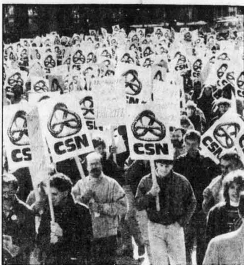
Quelque 1 300 délégués des quatre fédérations du secteur public de la CSN ont manifesté, hier, devant les bureaux du premier ministre à Montréal.

Les délégués ont aussi approuvé un plan d'appui à la négociation qui prévoit pour avril une première évaluation des négociations qui doivent débiter, si ce n'est déjà fait, en mars. C'est aussi à ce moment-là que la CSN