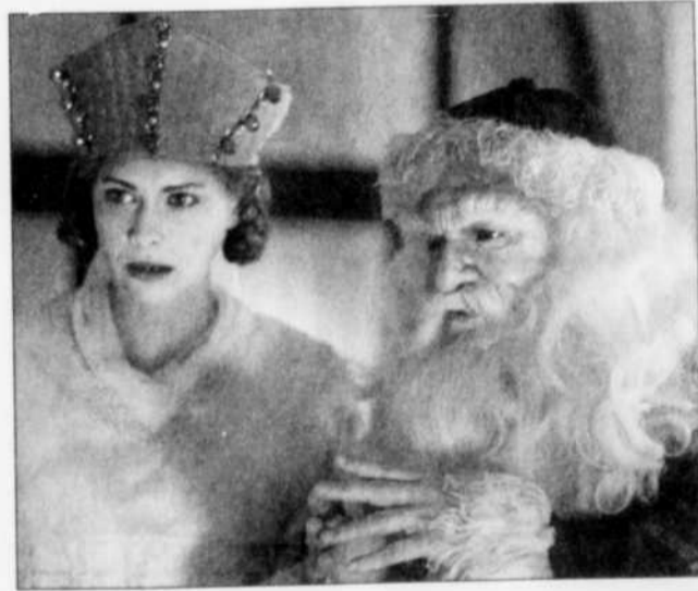
Bien malin qui pourrait reconnaître Benoît Brière, notre Monsieur B. national, presque méconnaissable, caché sous sa barbe blanche et affublé d'un gigantesque appendice nasal.