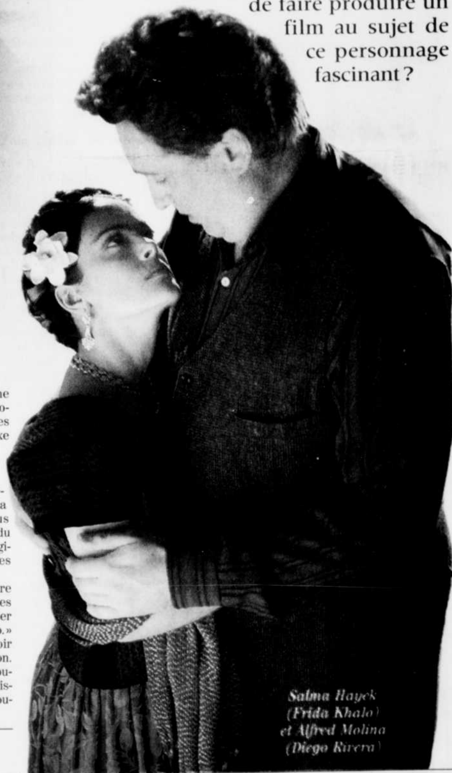
Salma Hayek (Frida Kahlo) et Alfred Molina (Diego Rivera)