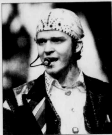
L'ex-petit ami de Britney Spears viendrait promouvoir son dernier CD.

Une rumeur de plus en plus persistante amène le préféré des adolescentes, le chanteur de N'Sync et ex-petit ami de Britney Spears Justin Timberlake à Montréal au cours de la semaine du 17 novembre. Le jeune homme aux boucles d'or serait de passage dans la métropole afin de promouvoir son premier album solo, Justified. Selon les informations reçues par LE SOLEIL, le chanteur accorderait un point de presse aux journalistes québécois et pourrait se produire dans les locaux de Musique-Plus. K.L.