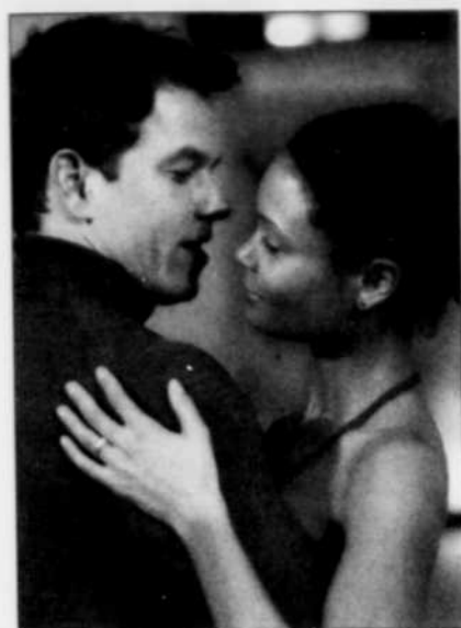
Regina (Thandie Newton) fera l'objet d'une cour assidue de la part de Joshua Peters (Mark Wahlberg).