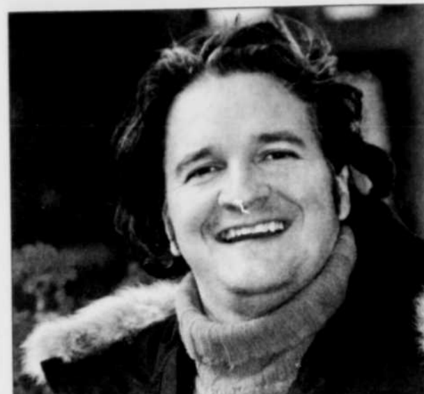
Plusieurs milliers de fans ont jeté un coup d'œil au dernier vidéo de Daniel Belanger dans Internet.