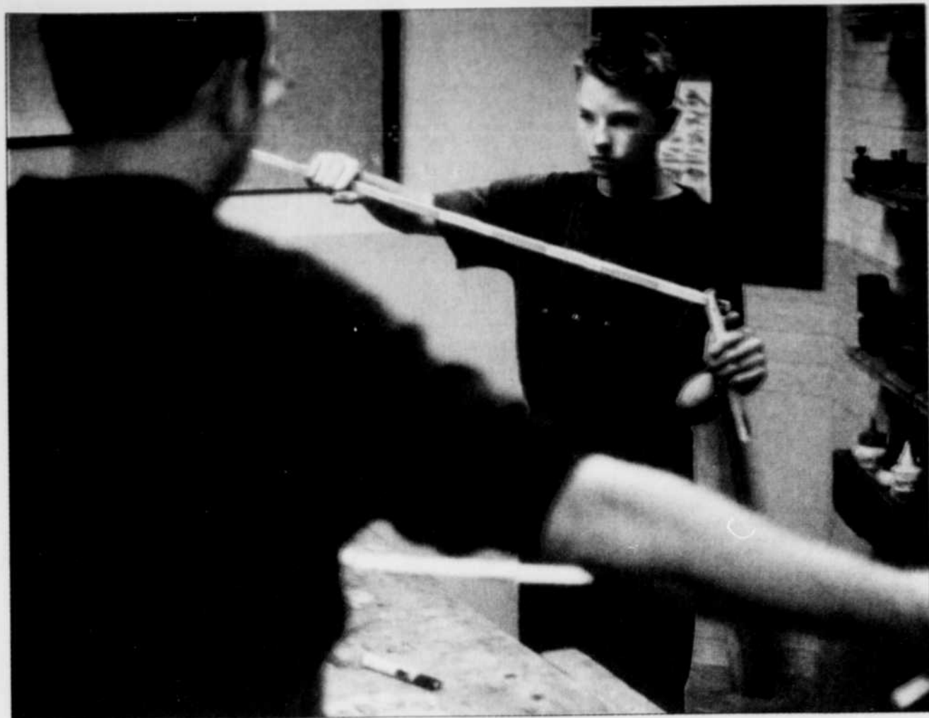
« LE FILS »