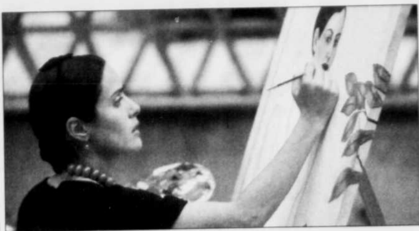
On comprend pourquoi la jeune actrice d'origine latine Salma Hayek a tenu à bout de bras ce projet depuis des années. À coup sûr, c'est le rôle de sa vie.