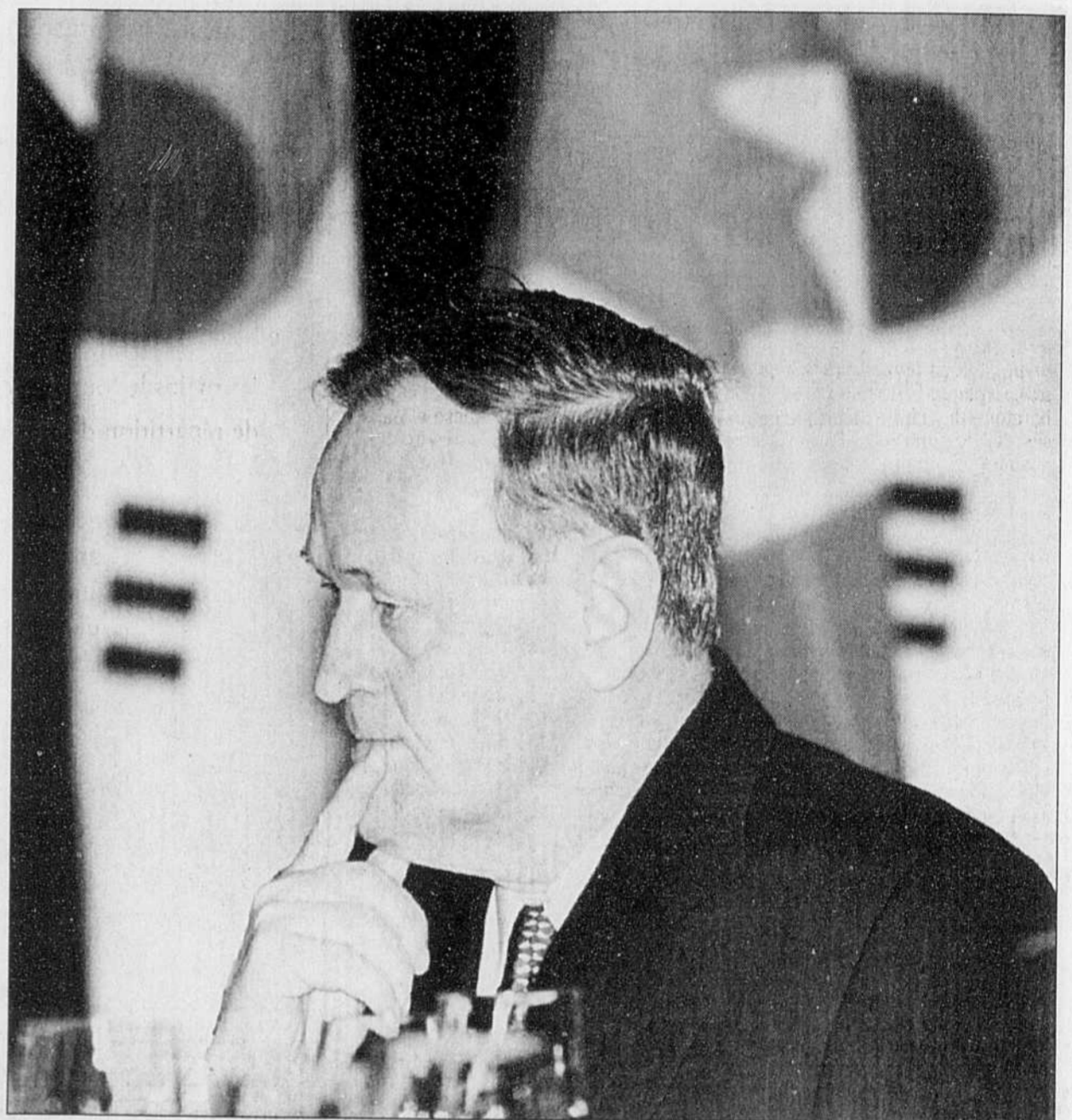
Le premier ministre Jean Chrétien était pensif, hier, lors du dernier déjeuner d'affaires du séjour d'Équipe Canada en Corée.

La visite en Corée aura permis la signature de 73