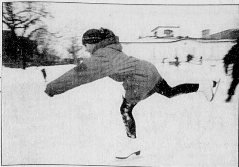
Les tribologues ont peut-être enfin trouvé une explication au phénomène qui permet aux lames de patin de glisser et aux patineuses de s'élaner élégamment.