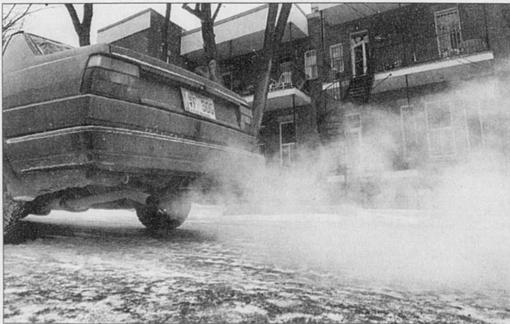
Une voiture qui se réchauffe toute seule un matin d'hiver: rêve de frileux ou calamité environnementale?

« Il faudrait », explique Michel Souigny, faire une véritable étude pour déterminer la durée optimale du réchauffement d'un véhicule, pour déterminer à quel moment on aurait un minimum d'émissions acides tout en contribuant le moins