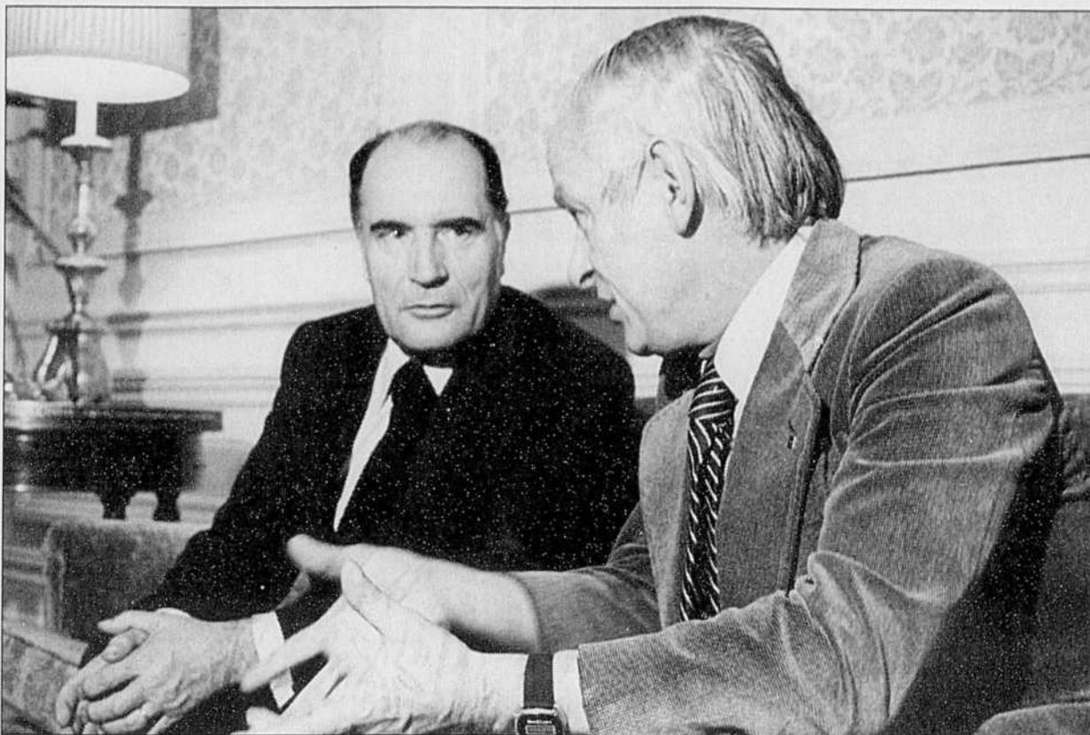
François Mitterrand et René Lévesque à l'occasion d'une de leurs rencontres.

L'objectif que s'était fixé René Lévesque dès 1972 était ainsi formellement atteint: l'importance de relations étroites entre le Québec et la France faisait désormais l'objet d'un consensus entre les majorités qui allaient alterner à la tête de la France.