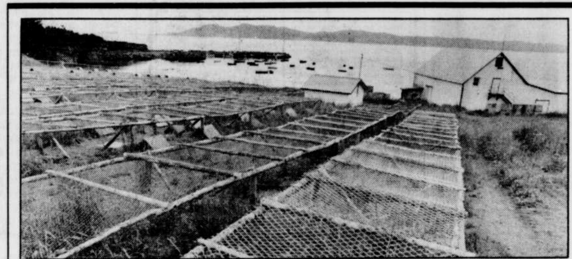
Les séchoirs à morues gaspésiennes sont de plus en plus vides et de plus en plus longtemps. Qu'il y ait ou non moratoire sur la pêche au fameux poisson dans le golfe Saint-Laurent, n'y changera sans doute pas grand-chose.

Fondée en 1971, la base de plein air de Pohénégamook en est à sa deuxième grève après celle du personnel de cuisine qui n'est pas en cause dans le présent conflit.