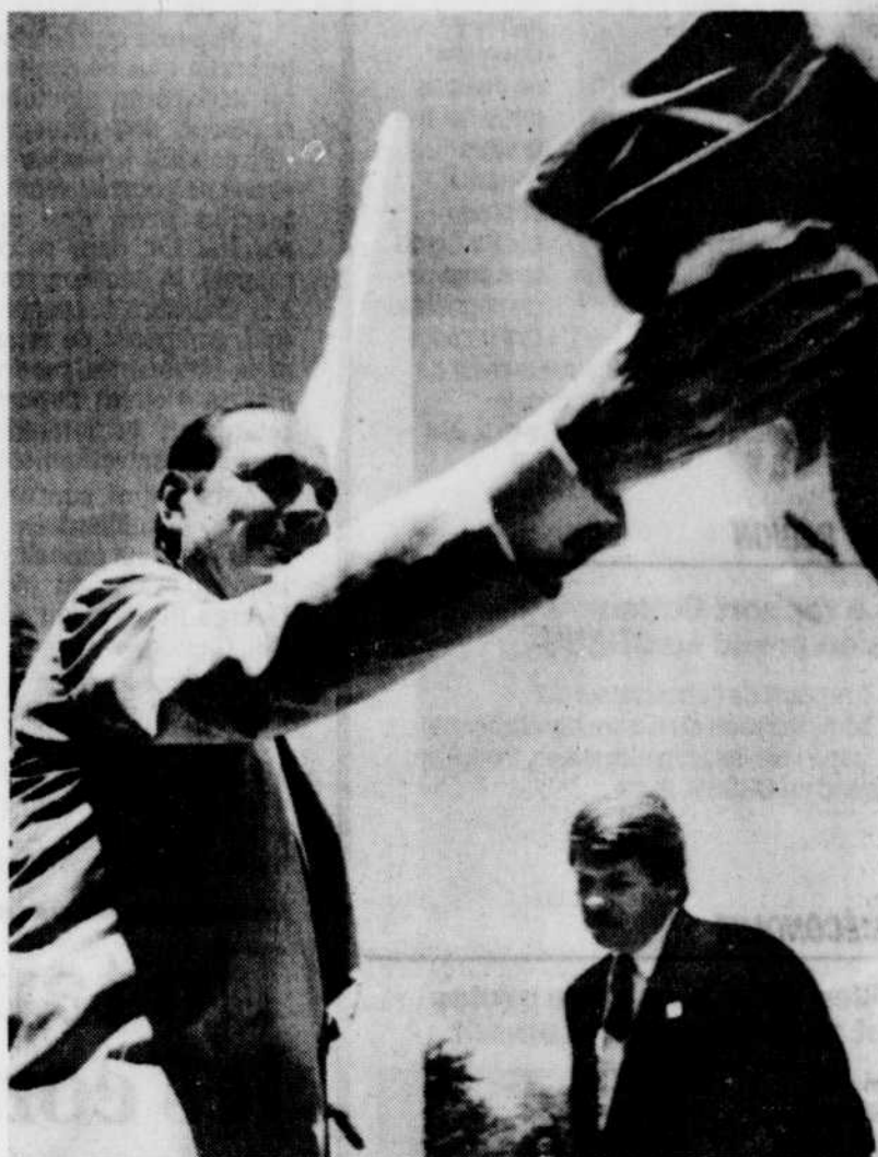
Le maire de Paris Jacques Chirac, que l'on voit ici en compagnie du maire de Montréal Jean Doré, a remis hier un drapeau français lors du dévoilement de l'obélisque à la mémoire du général Charles de Gaulle.

côté, a affirmé que le général de Gaulle « représentait et représentera encore longtemps des valeurs auxquelles nous, Montréalais, sommes attachés : liberté, courage devant l'adversité ».