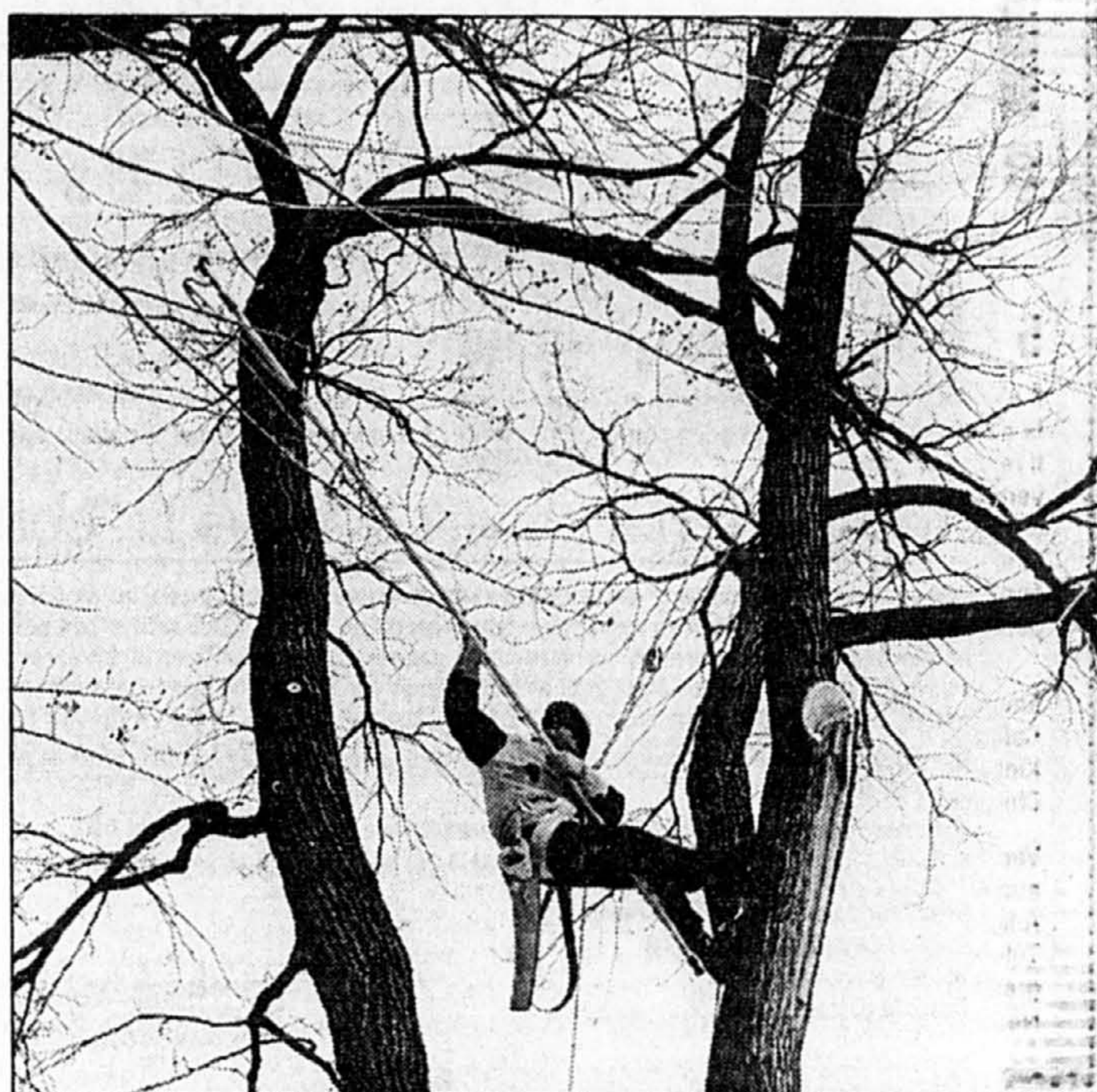
Arboriculteur-élagueur, un métier où il ne faut surtout pas craindre les hauteurs...

qu'il pleuve, vente ou grêle, l'arboriculteur est au poste, émondoir en main.