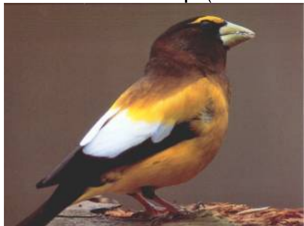
Gros Bec Errant