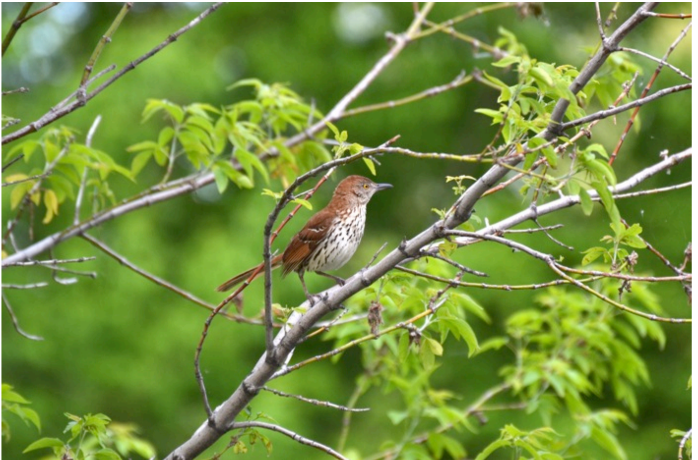
Moqueur Roux... 12 août 2011

Expressions populaires ayant pour thème les oiseaux : Madeleine Robidoux Intrépides pionniers des airs : Clément-Michel Côté Atlas des Oiseaux Nicheurs: Jean Crépeau Compte-rendu des sorties 2013 - 2014 : Lucille Cournoyer