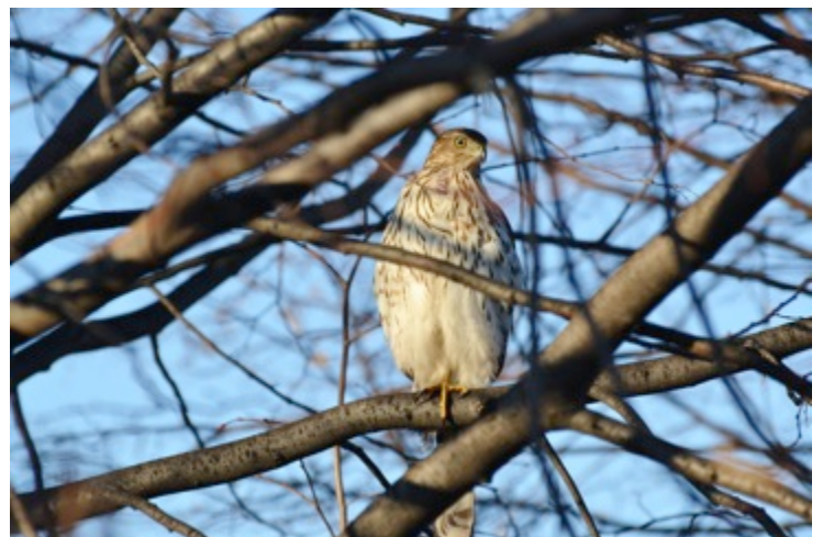
Épervier de Cooper Yamaska - Décembre 2011