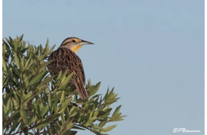
Sturnelle des Prés (Pierre Bannon)