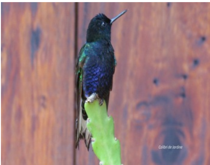
Colibri de Jardine