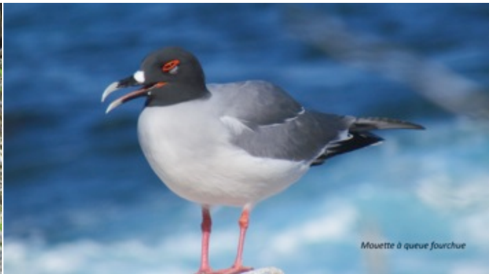
Mouette à queue fourchue