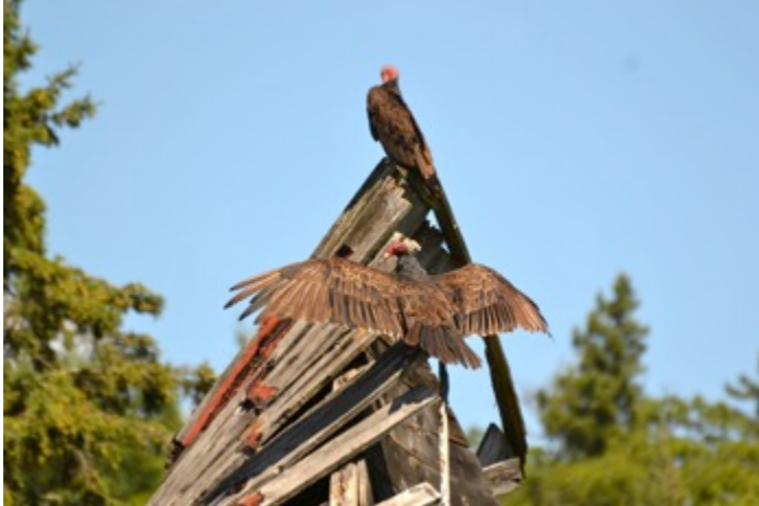
Urubu à Tête Rouge (Gilles Turcotte)