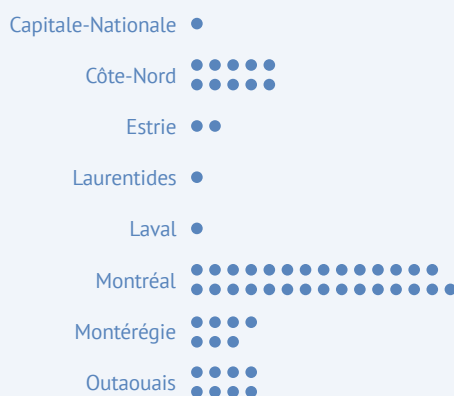
Figure 2 : Nombre d'établissements publics désignés offrant des services en anglais, par région

En conséquence, bien que les anglophones puissent avoir le droit de demander qu'un service soit offert en anglais, un tel accès n'est pas garanti à l'extérieur des établissements désignés 19 . En outre, la Charte de la langue française stipule que les employeurs, y compris ceux relevant de la fonction publique (p. ex., les hôpitaux), ne peuvent pas exiger la connaissance d'une langue autre que le français, sauf s'il est possible de prouver qu'il s'agit d'une exigence nécessaire et que des mesures ont été prises pour éviter d'imposer une telle exigence 20 .