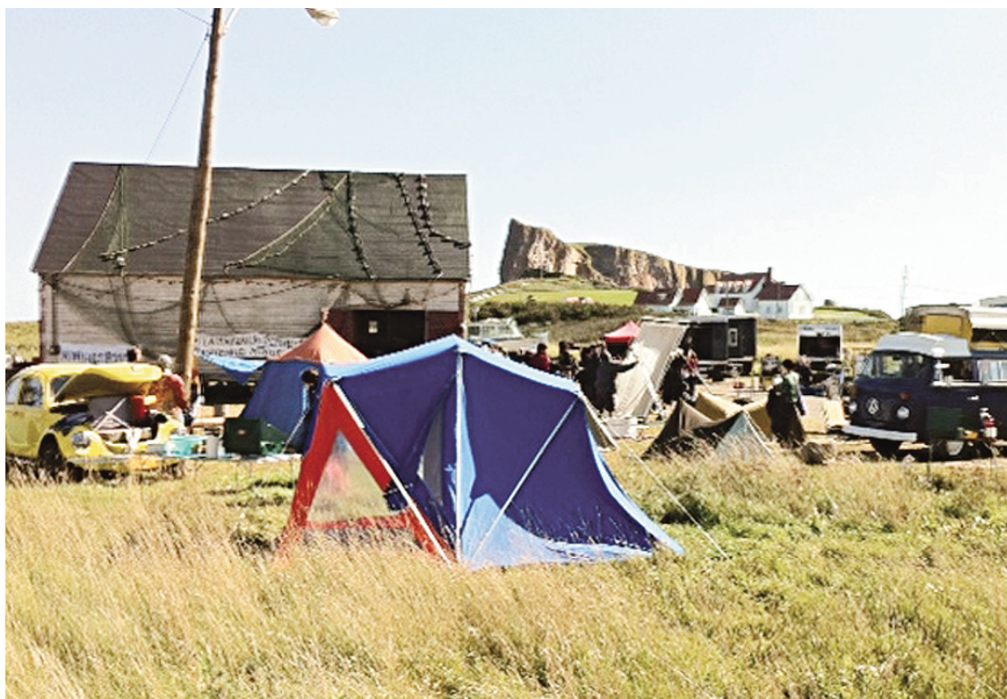
Pendant le tournage du film La Maison du pêcheur

Une quarantaine d'années plus tard, Octobre nous colle toujours à la peau. Le sujet fait toujours réagir. En 2010 paraît l'excellent roman de Louis Hamelin La constellation du Lynx (Boréal). Le romancier récidive cette année avec Fabrications (PUM), un essai littéraire cette fois, qui se veut aussi politique et historique.