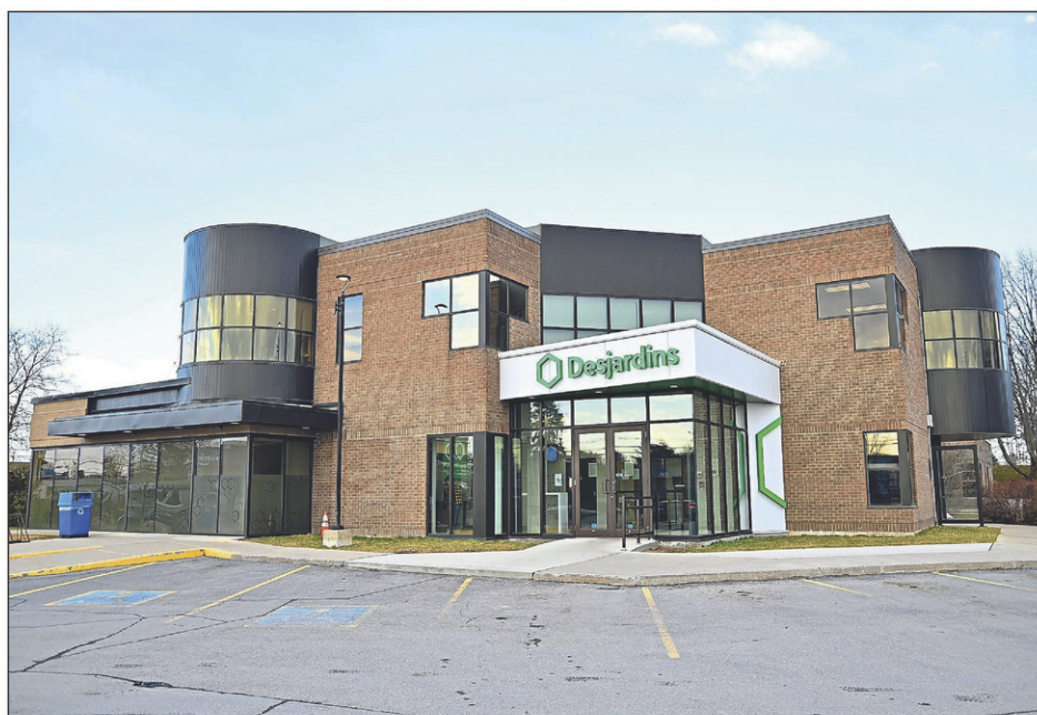
Les membres de la Caisse Desjardins du Haut-Richelieu sont invités à participer à l'assemblée générale annuelle qui se tiendra en mode virtuel le 18 avril.

L'assemblée générale annuelle commencera sur le coup de 19 h 30. Les personnes qui souhaitent y assister trouveront le lien