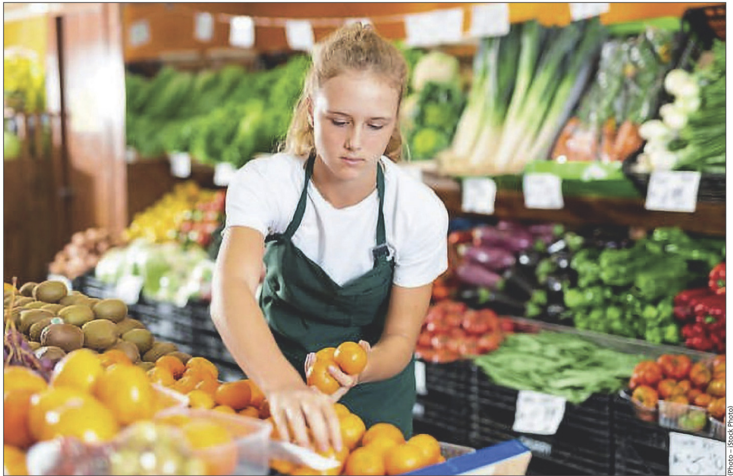
La Chambre de commerce et de l'industrie salue le projet de loi 19 sur l'encadrement du travail des enfants au Québec.

« Il est d'ailleurs très important que les parents et les employeurs assurent un bon encadrement et priorisent la persévérance scolaire. J'espère aussi que les parents