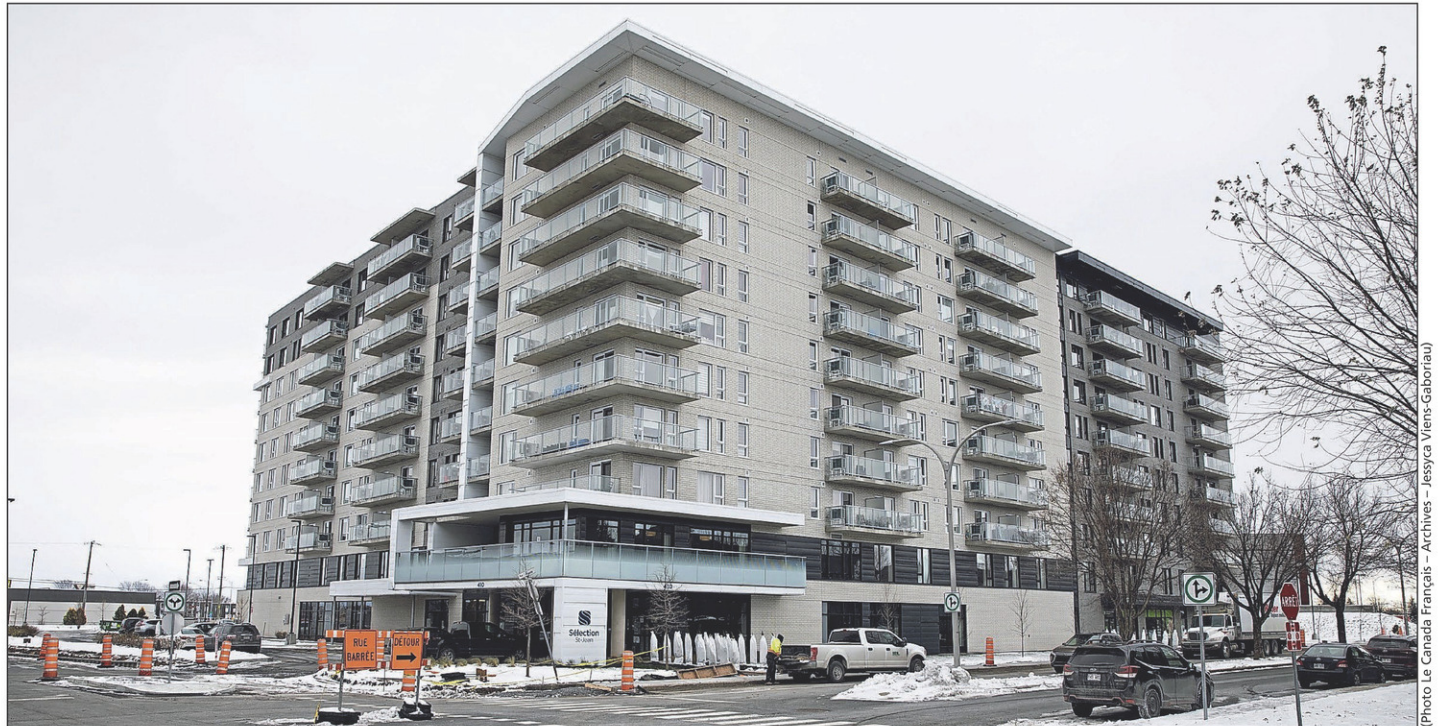
Le Sélection St-Jean, maintenant appelé le Vilia St-Jean, est situé sur la rue Laberge.

Depuis le 1 er avril, à minuit, c'est Cogir qui s'occupe des immeubles, incluant le Sélection St-Jean. Ce dernier change