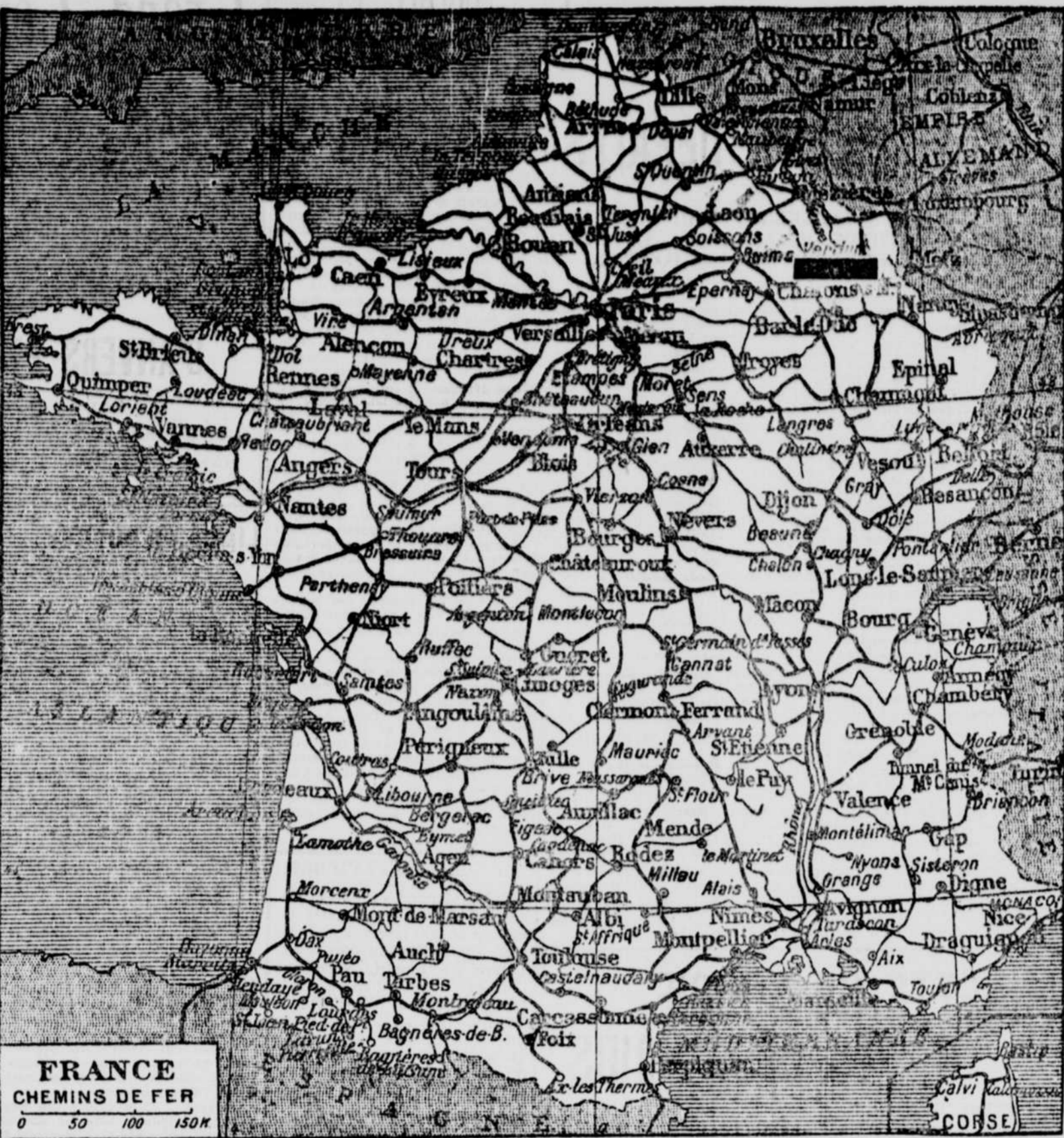
Aux environs de Verdun, (souligné d'un trait noir), une bataille gigantesque est engagée. Deux cent quatre-vingt mille Allemands se ruent vers cette place forte pour l'encercler et faire une trouée vers Paris. A maintes reprises, le Kronprinz, qui commande l'armée allemande a essayé de percer les lignes françaises. Verdun est une place forte qui, lors de la grande avance allemande en août 1914, sut résister aux assauts de l'armée d'invasion.