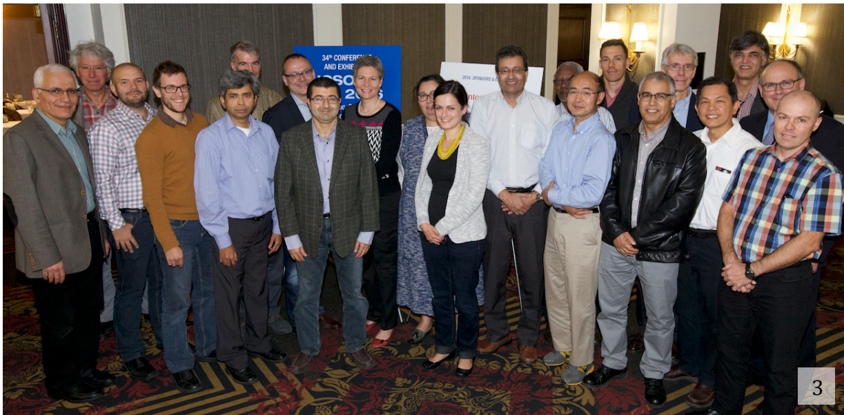
Figure 3. Assemblée des membres 2016