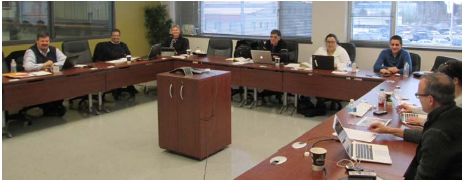
Figure 2. Réunion du BDR.

Lors de la période 2016-2017, le BDR s'est réuni à 6 reprises (BDR-46 à BDR-51). Les procès-verbaux ont été approuvés lors de la séance suivante et déposés dans l'intranet du REGAL, accessibles à tous les membres réguliers.