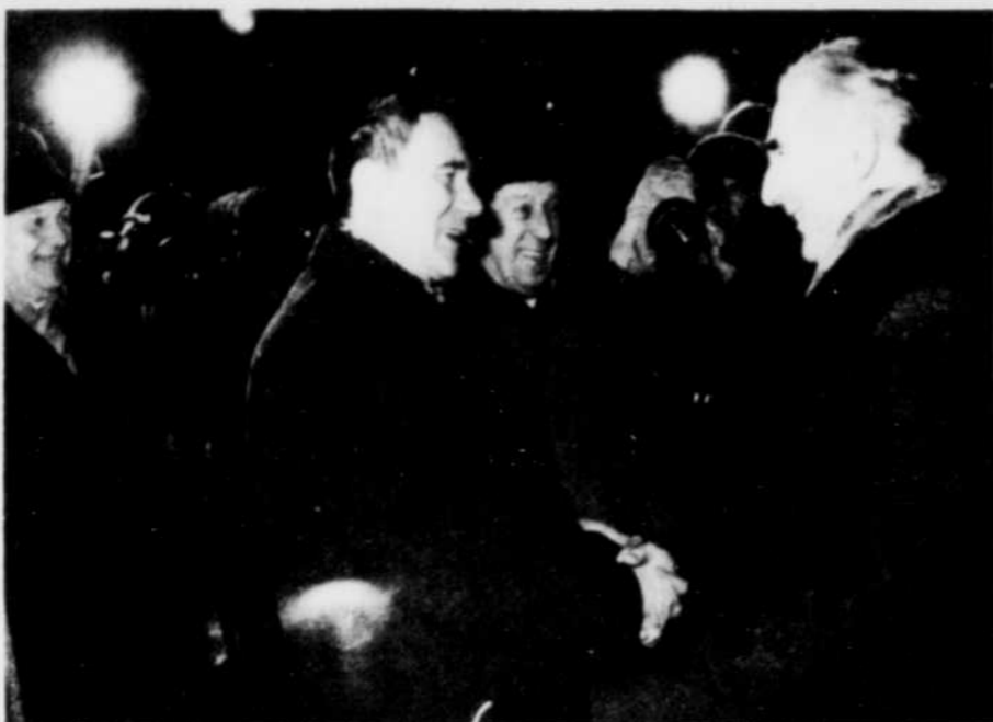
Le ministre soviétique des Affaires étrangères, Andrei Gromyko, accueille son homologue polonais, Josef Chyrek, à Moscou, où les deux hommes s'entreprendront d'un possible assouplissement de l'application de la loi martiale en Pologne.