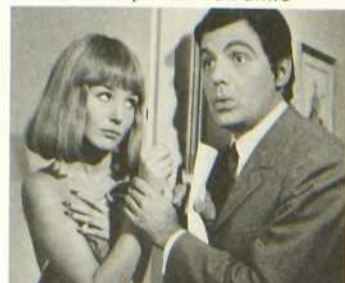
Faites donc plaisir aux amis

Un coureur de jupons, farceur et joyeux drille, Jean-Louis Brunel, est un modeste vendeur d'automobiles pour le compte de son ami d'enfance, Lucien Barjon, riche propriétaire d'un important garage de Paris. Un beau jour, Jean-Louis apprend par télégramme que son frère Maximilien, qui a fait fortune en Amérique latine où il est devenu le «roi de la conserve», vient séjourner quelque temps dans la Ville Lumière. Hâbleur, par surcroît, Jean-Louis avait vanté souvent par lettres à Maximilien sa vie d'homme arrivé: propriétaire d'un immense garage, mari d'une beauté blonde, appartement huppé, grosse voiture, etc. Pour sauver la face, à l'occasion de la visite inattendue de son frère, il demande à son ami et patron la permission d'adopter pour quelque temps l'identité et le train de vie de ce dernier. Lucien accepte et entre dans le jeu. Il s'ensuit alors une cascade de situations loufoques, de quiproquos, d'imbroglios, de rebondissements étourdissants propres à la comédie faite pour dérider et qui souvent y parvient.