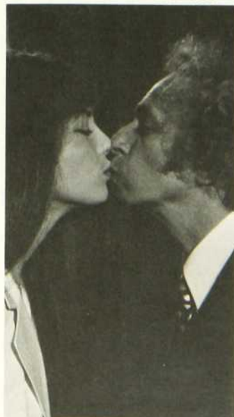
La moutarde me monte au nez

Un professeur doué pour l'écriture rédige avec la même habileté les discours électoraux de son père et les articles à scandale d'un journaliste ami. Distract, le professeur se fait jouer des tours pendables par quelques-uns de ses élèves, en mal de rigolades, qui intervertissent les écrits de leur maître. Il en résulte pour ce dernier, on le devine, des complications inattendues.