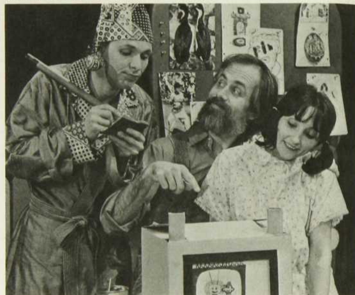
Au jardin de Pierrot