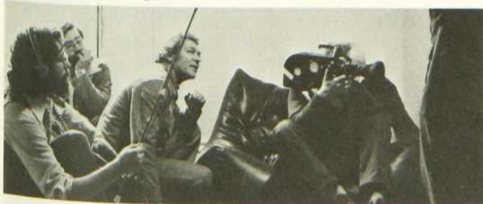
Une équipe de tournage de la série «Les Exclus»

Les Jeux Olympiques, reflet de l'Histoire jeudi 3, 21 h 30