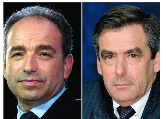
Jean-François Copé, à gauche, et François Fillon