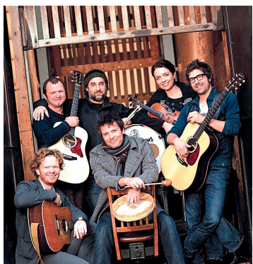
Le groupe Mes Aïeux