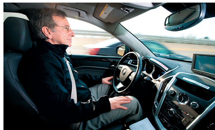
Le système Super Cruise essayé par GM au Michigan, en mars 2012, sur une Cadillac.