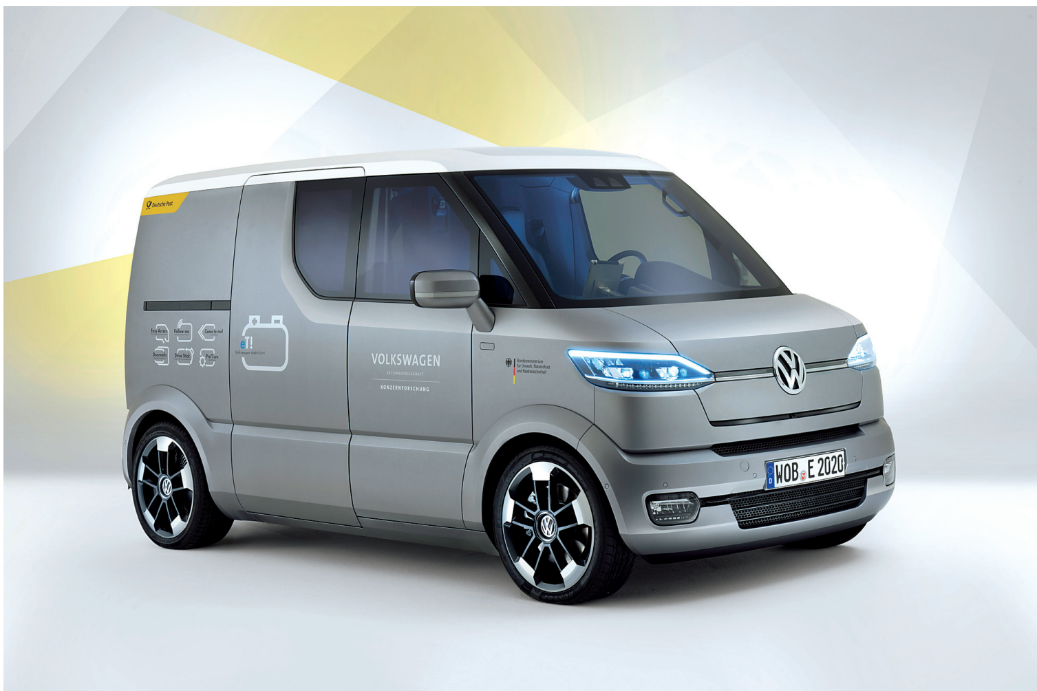
La fourgonnette de livraison expérimentale Volkswagen e! répond aux commandes vocales des facteurs allemands. Elle peut notamment se déplacer vers l'utilisateur lorsqu'il lance la commande « Come to me ».