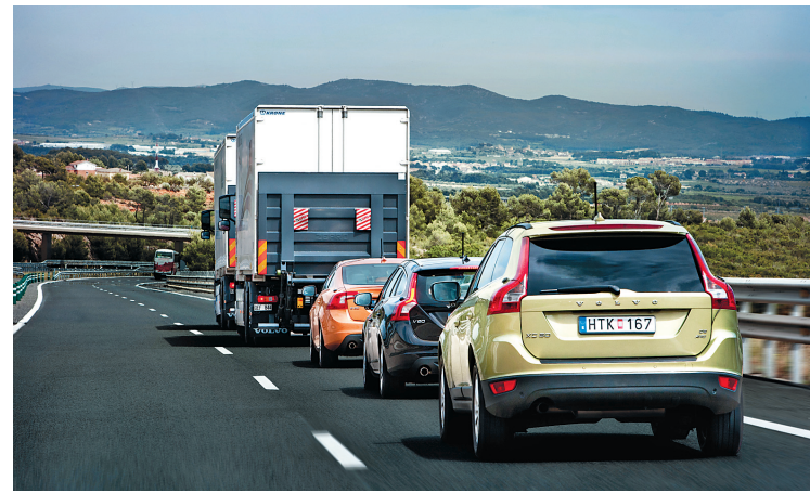
Ce convoi de véhicules autonomes, arrimés électroniquement au véhicule de tête (le camion), a parcouru 200 km sur l'autoroute.