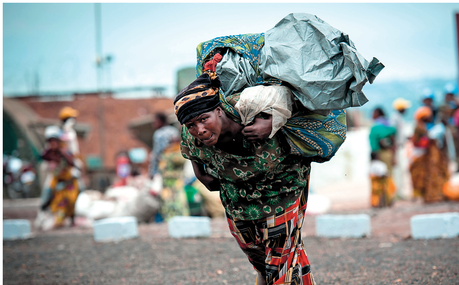
Une réfugiée congolaise avec tous ses biens à quelques kilomètres de Goma, la capitale régionale du Nord-Kivu.