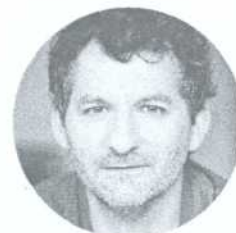
JOËL BEDDOWS METTEUR EN SCÈNE

En tant que metteur en scène, Joël Beddows est reconnu comme ayant un vif intérêt pour un théâtre onirique, pour le développement dramaturgique et pour les pratiques