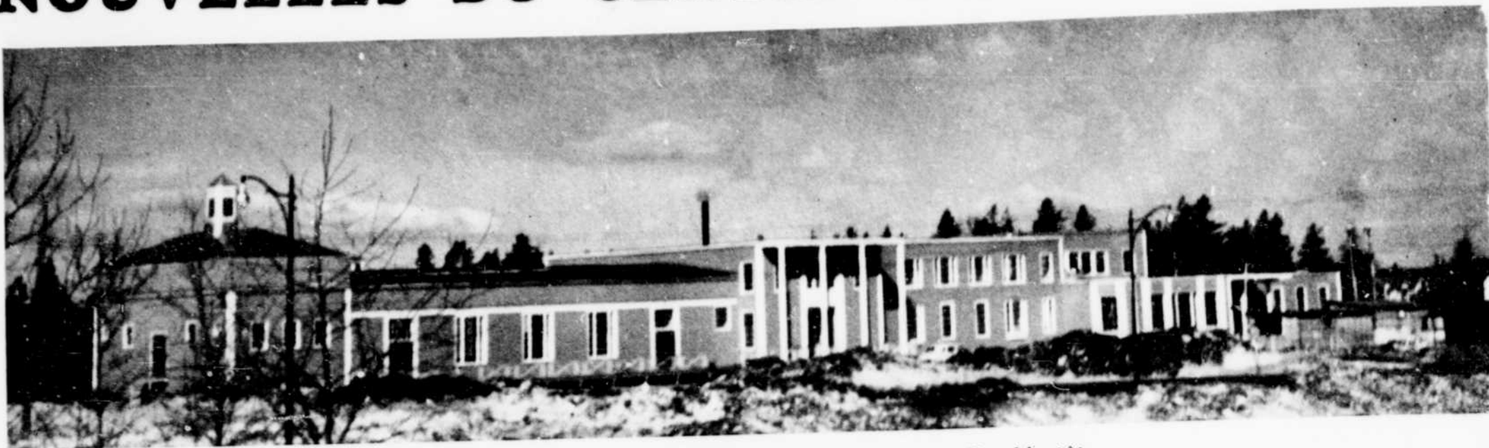
Le nouveau centre de récréation dont l'inauguration aura lieu bientôt.

L'Aluminum Company of Canada, Limited a abandonné l'administration et l'opération du Centre de Récréation à l'Association Athlétique d'Arvida.