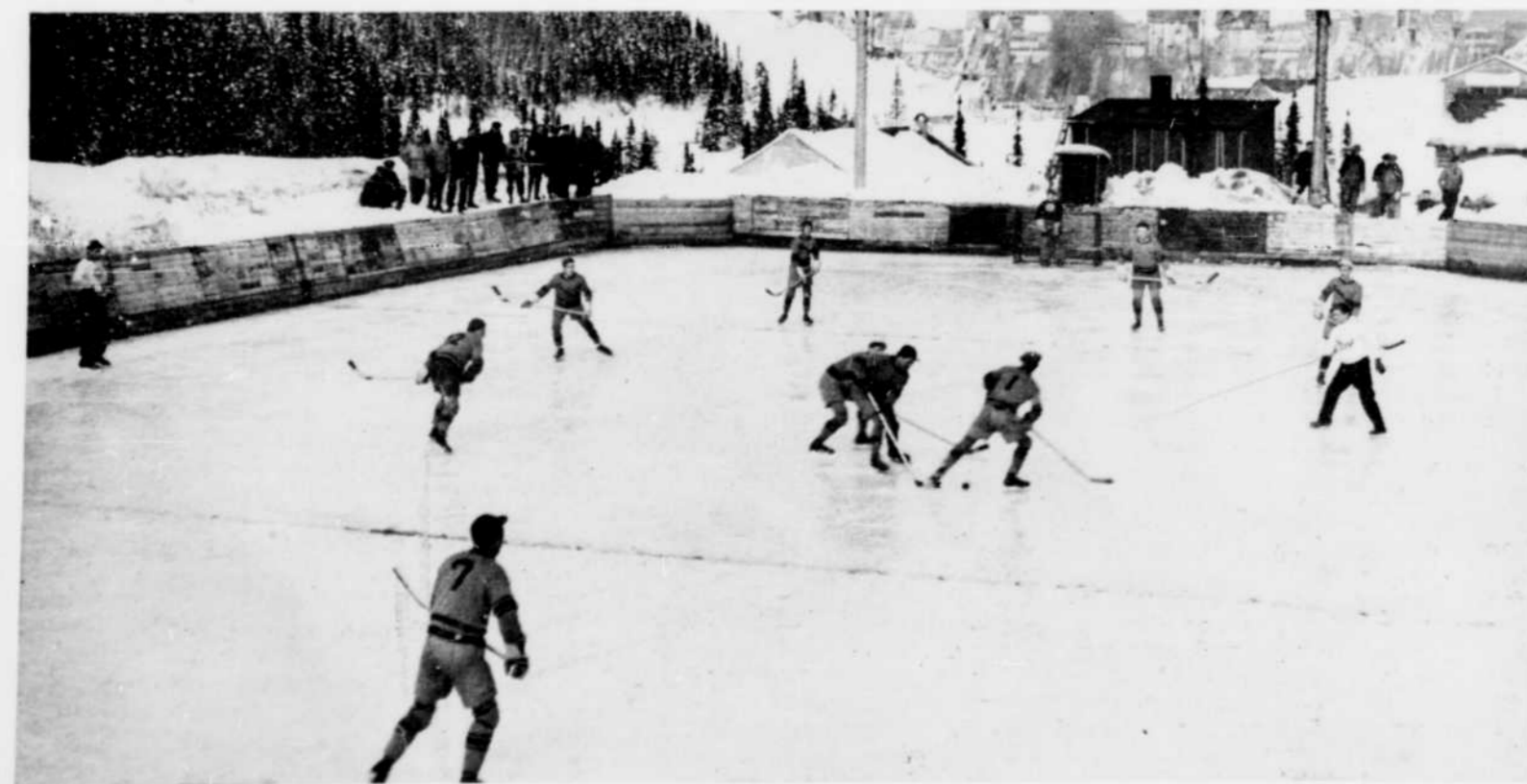
Le hockey fut un sport très en vogue. On voit ici une partie animée dans un décor que n'ont pas d'habitude les patinoires