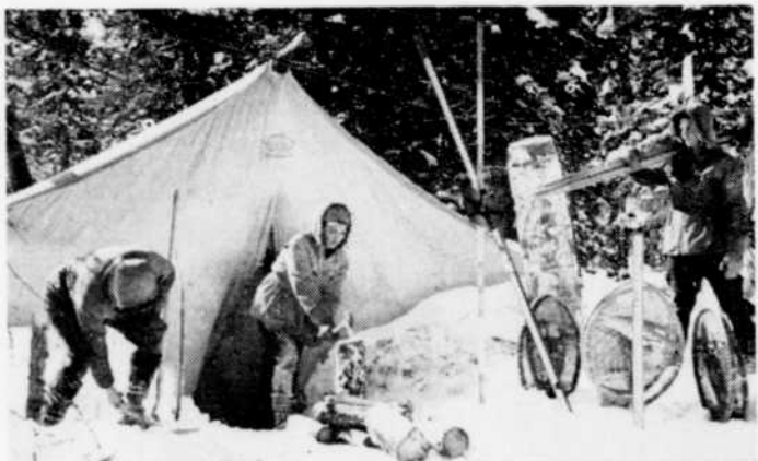
Trois arpenteurs de la Compagnie à leur campement.

Pendant que les jeunes s'amusaient ferme au grand air, leurs aînés organisaient des concours de