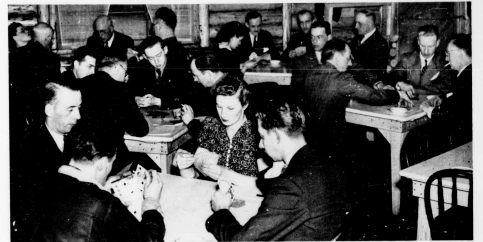
Une partie de bridge aux Passes.