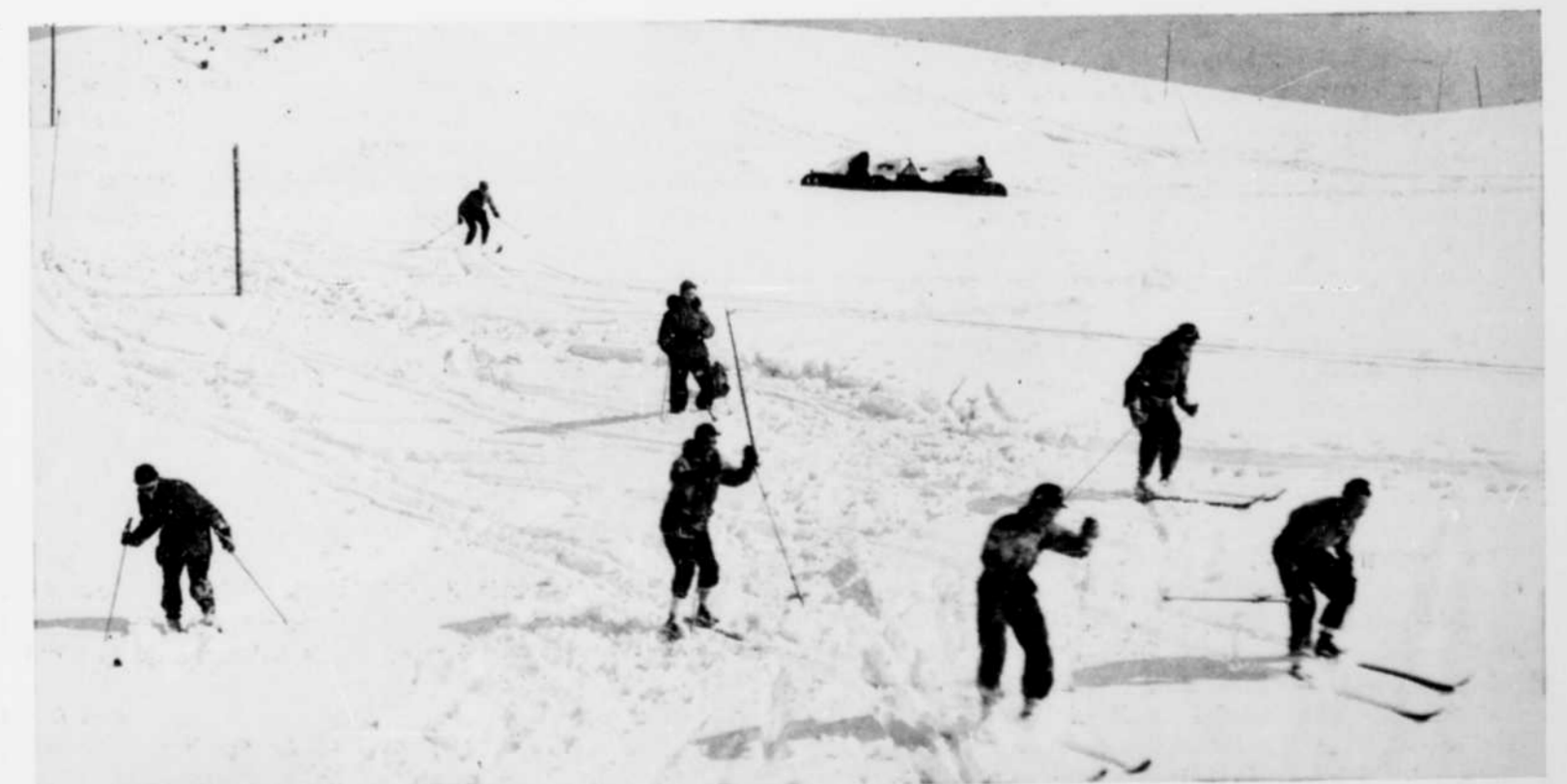
Le ski fut également un sport très populaire.