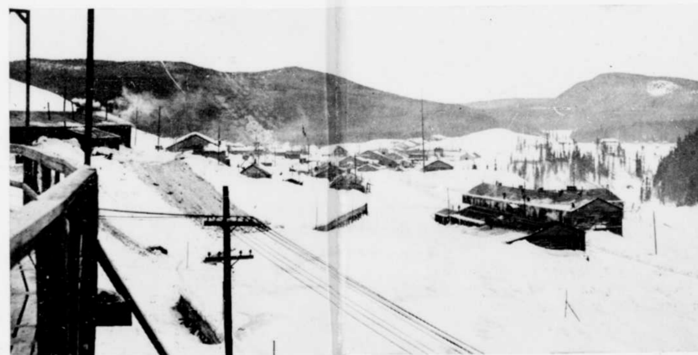
Le village des Passes-Dangereuses enfoui sous la neige.