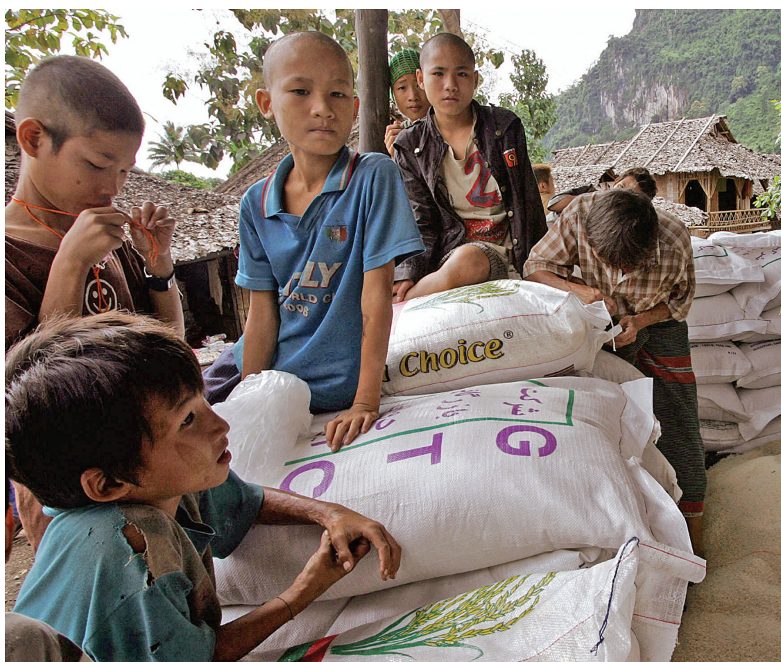
Jeunes réfugiés birmans à la frontière thaïlandaise

Hélène Magny est journaliste indépendante. Elle vient de coréaliser un documentaire, Birmanie l'indomptable: la résistance d'un peuple, à la frontière thaïlandaise et à l'intérieur de la Birmanie, dont le tournage a duré trois mois.