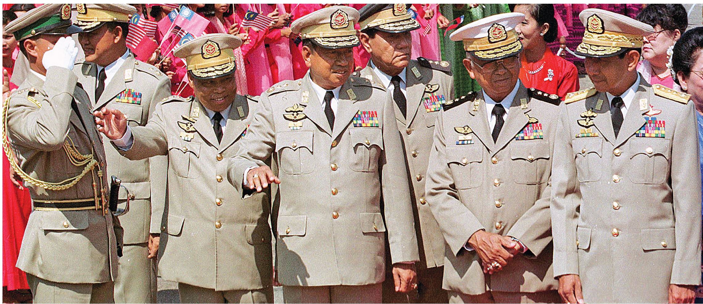
La junte birmane. La «confrérie» de l'Association des nations de l'Asie du Sud-Est (ASEAN) n'hésite pas à brandir sa sacro-sainte charte de «non-ingérence dans les affaires intérieures de ses membres» quand il s'agit d'imposer des sanctions au régime birman.