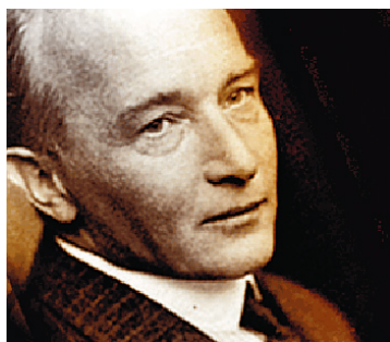
L'écrivain et philosophe Robert Musil

Poète, romancier et journaliste littéraire pigiste, l'auteur a publié plusieurs livres, dont les plus récents sont les romans J'invente la piscine ( La Courte Échelle , 2010) et Lectodôme ( Quartanier , 2008). Amateur de philosophie et d'art contemporain, il termine présentement la rédaction d'un prochain roman portant sur le problème sidérant de la liberté, qui, selon Tolstoï, ne serait que le résultat de notre ignorance des lois naturelles de la nécessité.