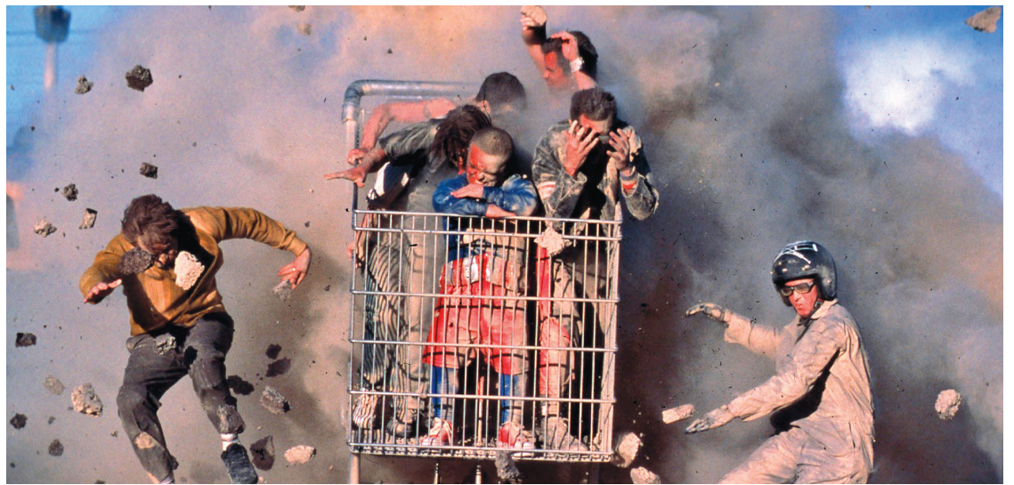
Une scène du film Jackass the Movie (2006).

Pour être plus juste, Jackass perpétue, en version body art et sur un mode spectaculaire, le cynisme de potache qui est devenu une nouvelle forme d'expression populaire aux États-Unis depuis l'avènement des Simpsons , South Park , Beavis and Butt-Head (per-