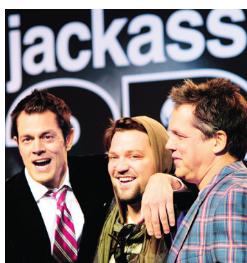
Les acteurs Johnny Knoxville et Bam Margera avec le directeur Jeff Tremaine, à la première du film Jackass 3D à Berlin, le 25 octobre dernier.

sonnages imbéciles qui ouvrent d'ailleurs le film Jackass 3D ), Family Guy et autres dessins animés du même type.