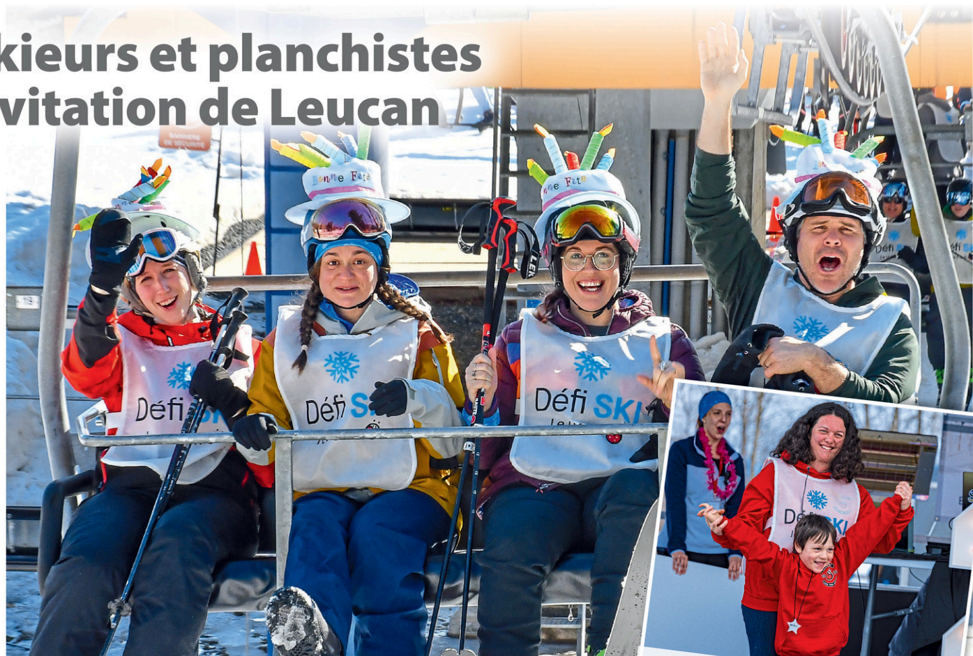
Quelque 500 skieurs et planchistes ont pris part à la 20 e édition du Défi ski Leucan.

Cet événement caritatif, coprésenté par Fenplast et Thaïzone dans plusieurs stations de ski, constitue l'une des principales activités de financement de Leucan. Les amateurs de sports de glisse peuvent s'inscrire de façon individuelle, en équipe ou de manière corporative et sont tenus d'amasser un montant minimum en dons ou commandites.