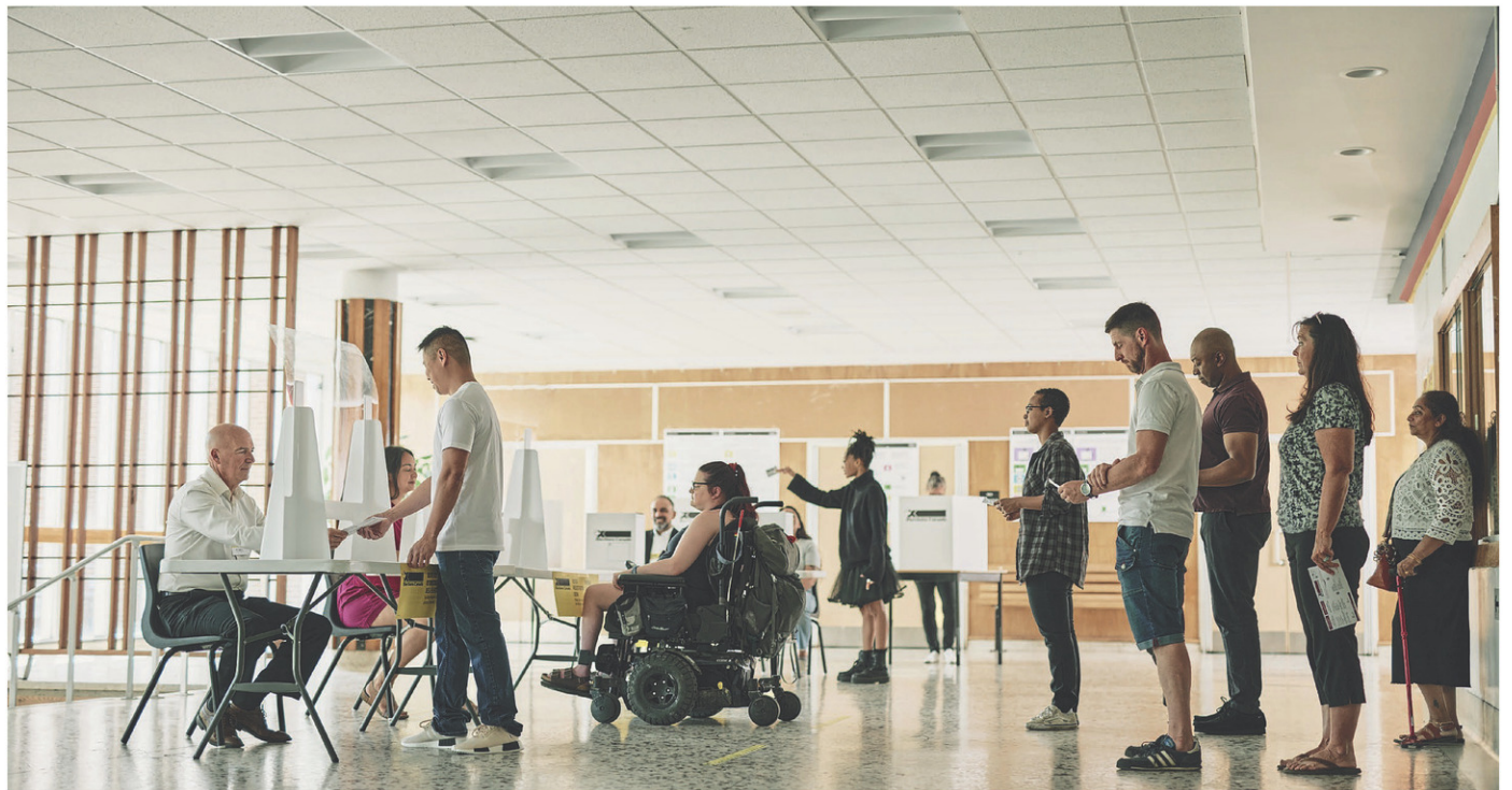
La campagne électorale se conclura à la fin avril.

Elle avait été élue pour la première fois lors du dernier scrutin il y a quatre ans, avec