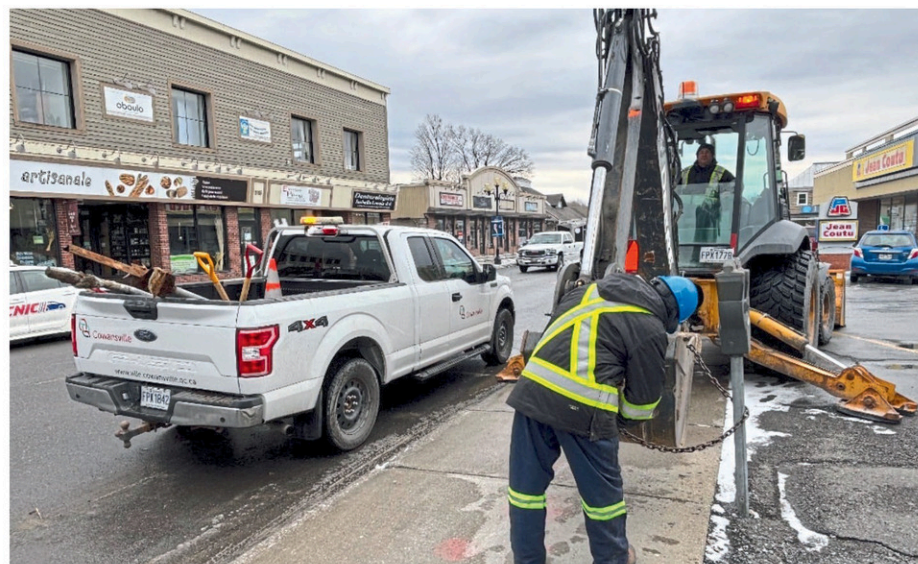
La Ville procède au retrait des parcomètres au centre-ville.

Cowansville rappelle également que depuis