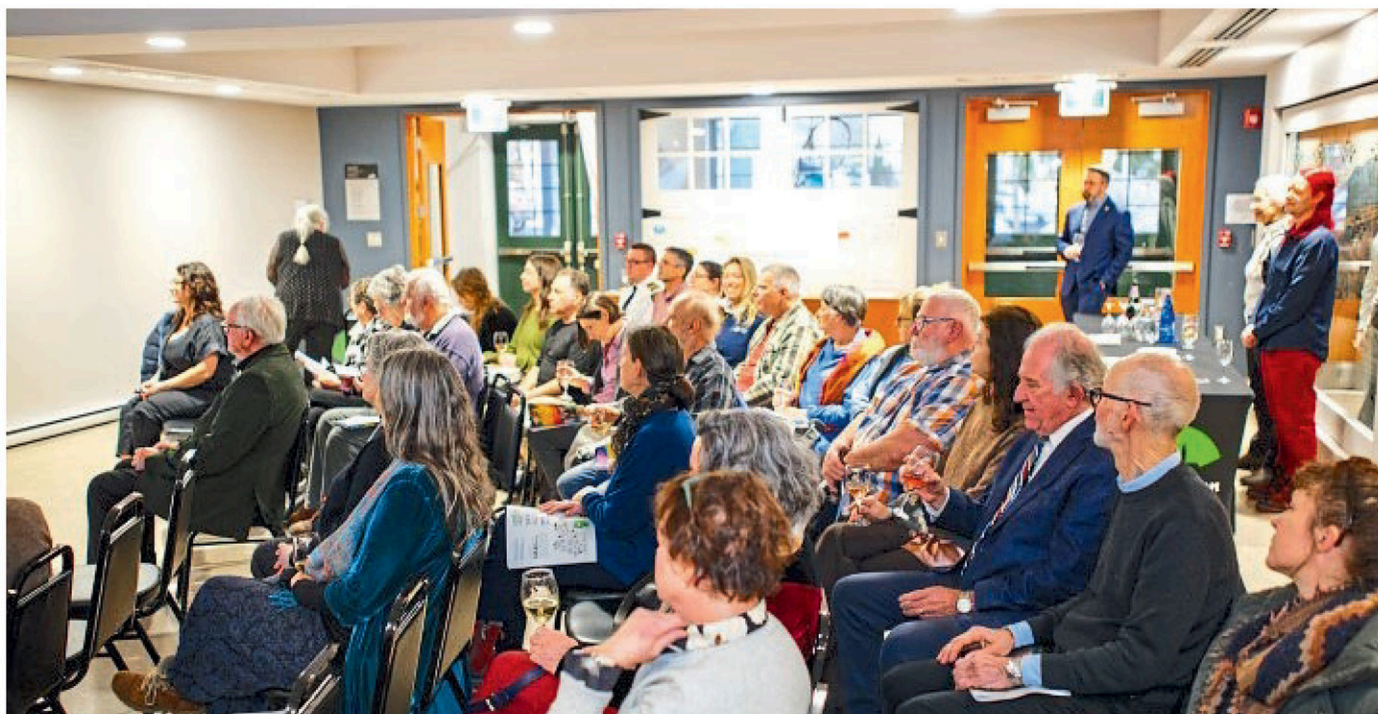
Une trentaine d'acteurs du milieu culturel local ont assisté à cette soirée de présentation.

Les citoyens sont par ailleurs invités consulter la politique culturelle et le plan d'action 2025-2029 sur le site Web de la Municipalité. On peut également se procurer un exemplaire imprimé à la réception de l'hôtel de ville.