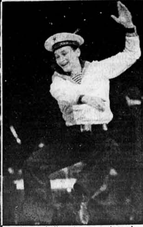
Le Choeur de l'armée rouge et ses danseurs: 10 000 spectateurs ravis au Forum hier soir.