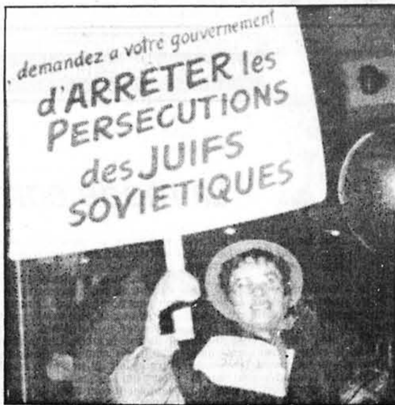
Quelque 200 personnes représentant plusieurs groupes ethniques ont manifesté pacifiquement hier soir devant le Forum pour attirer l'attention sur l'incongruité d'inviter le choeur de l'Armée rouge pour promouvoir la paix tandis que cette même Armée rouge sevit en Europe de l'est depuis 1945. En témoignaient hier soir des Ukrainiens, des Lettons, des Lithuaniens, des Afghans et des juifs.

Moyens limités, donc, et, néanmoins, l'atmosphère y est. La peur qui s'installe parmi ces Carmélites condamnées à être décapitées, nous la vivons nous aussi dans la salle. En dépit de bien des mouvements de bras inutiles, la mise en scène de Colette Boky est toujours vraie, les éclairages soulignent parfaitement bien chaque tableau, et le piano agissant de