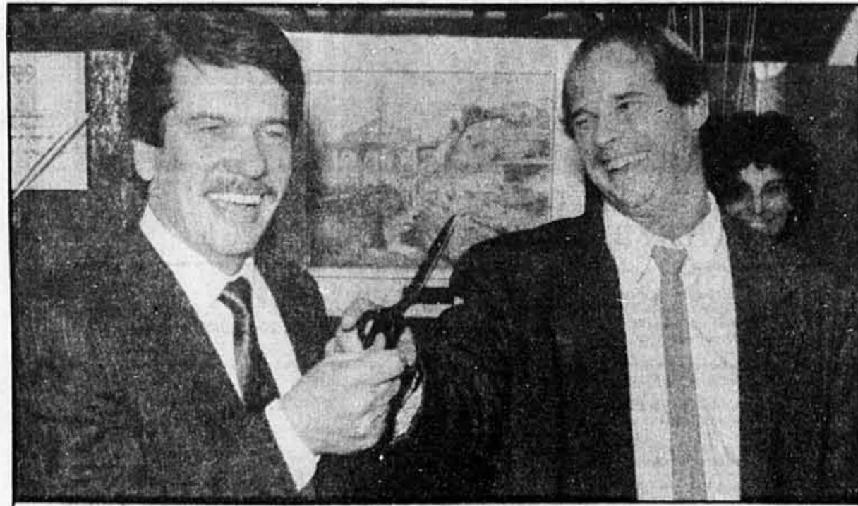
Le Cirque du Soleil emménage