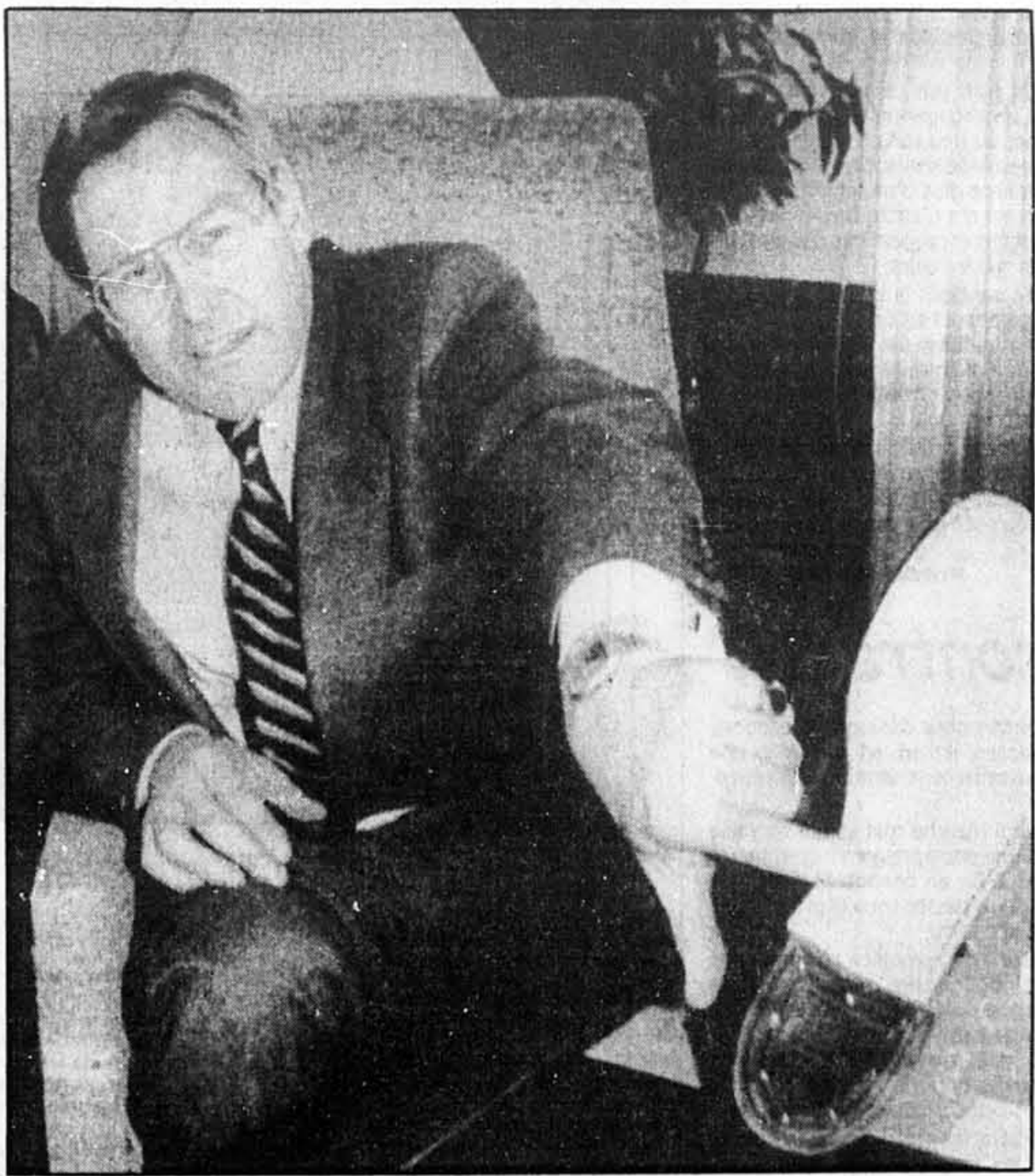
Le ministre fédéral des Finances, M. Michael Wilson, a fait l'essai hier, à la veille de la présentation de son budget, de la traditionnelle paire de chaussures. Il a fait remarquer aux journalistes l'inscription « made in Canada », sur les semelles.