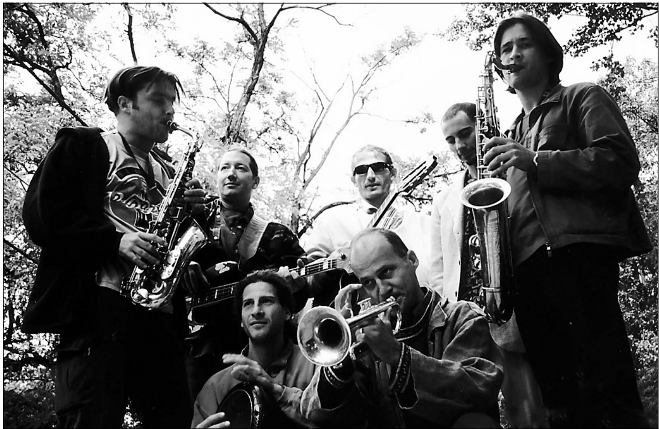
Les membres de Besh O Drom avec leurs instruments volatilisés.