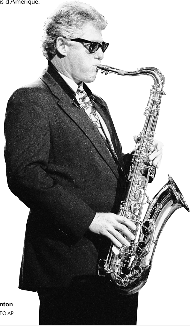
Bill Clinton

— THOMAS JEFFERSON (1743-1826), rédacteur de la Déclaration d'indépendance, premier leader du Parti républicain et troisième président des États-Unis d'Amérique.