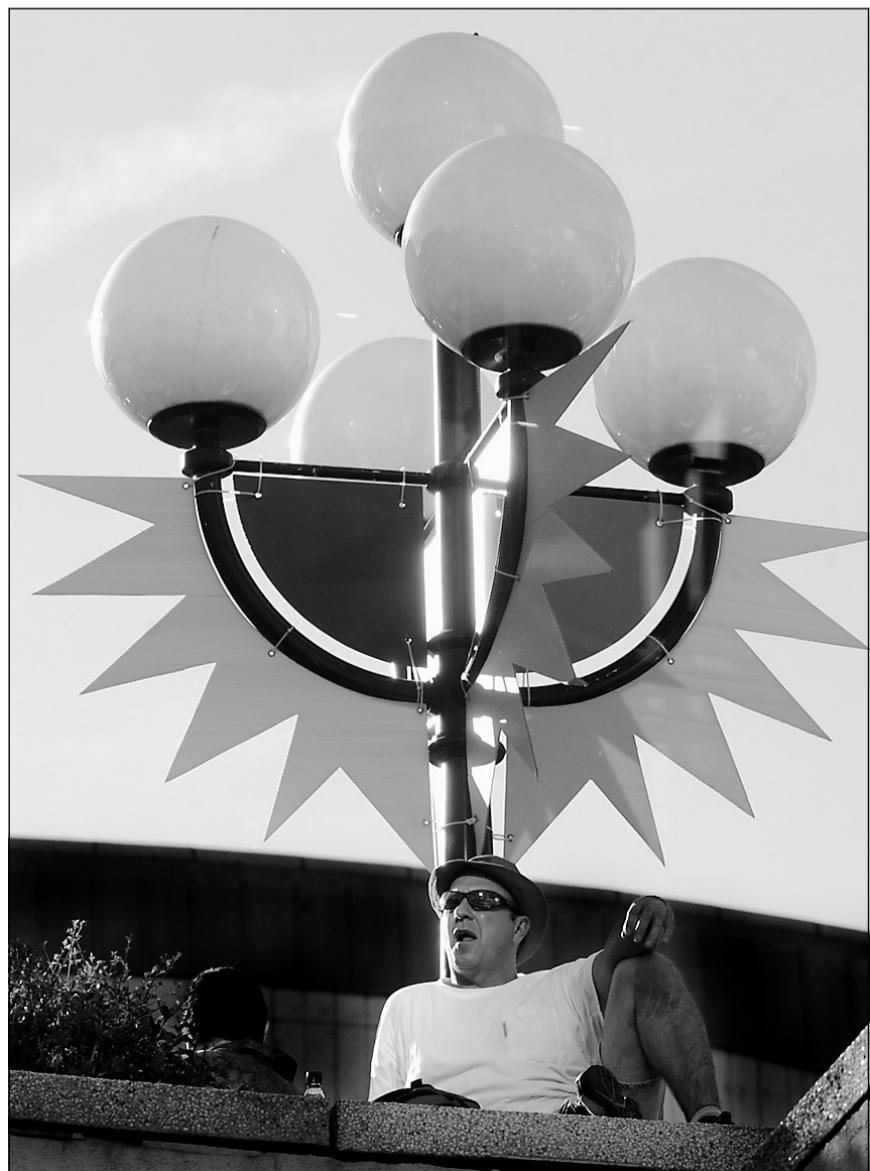
Ce festivalier n'a pas oublié qu'on va aussi au festival pour se reposer un peu...