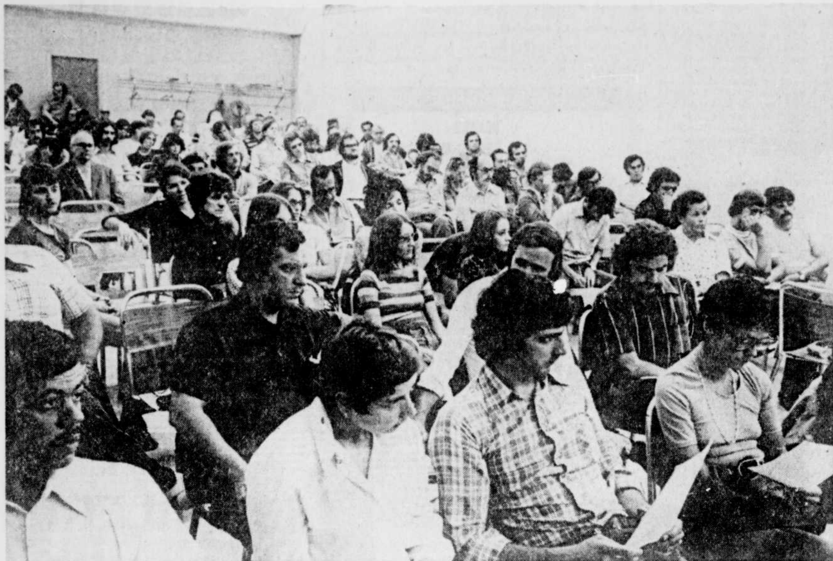
Les journalistes ont tenu deux assemblées générales en fin de semaine. L'une pour déclencher un arrêt de travail et l'autre pour voter le retour au travail.