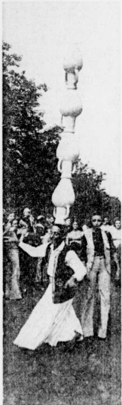
Pour plusieurs, une dernière image de la Superfrancofête avec le défilé de samedi à Québec: les porteurs tunisiens de gargouillettes.