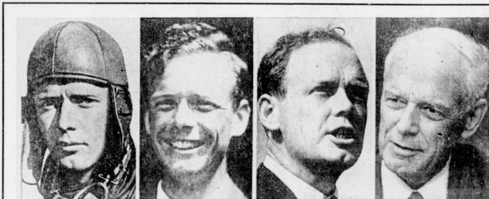
Charles Lindbergh photographé en 1927, 1931, 1940 et 1973.