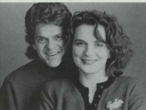
MARIE-THÉRÈSE FORTIN Catherine DANIEL GADOUAS Philippe