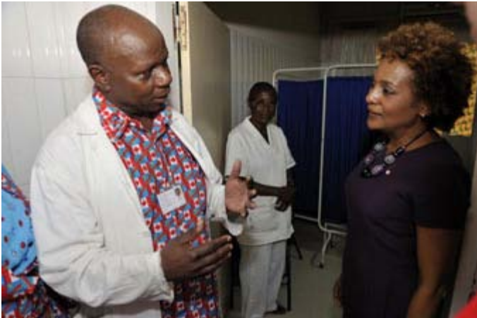
Michaëlle Jean, en présence du personnel soignant de la Clinique Ngaliéma.