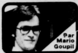
Par Mario Goupil