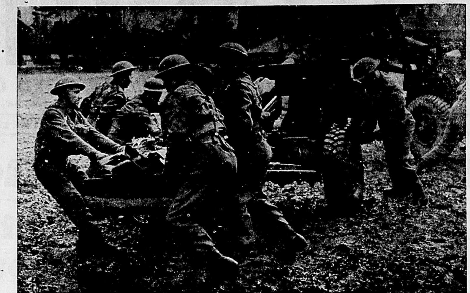
Quelques secondes après que cette canon se faisaient entendre, photo fut prise, l'affût était sur le sol, les roues sur leur plate-forme et les premiers coups de...

leurs. Ils en discutent en tout temps et en tout lieu. Chacun prétend que son arme est la plus efficace et la plus importante, son équipe, la mieux entraînée. Cela montre à quel point ces soldats sont enthousiastes, à quel point ils prennent leur rôle au sérieux. Ceux qui appartiennent à des batteries anti-aériennes ont facilement le dessus dans ces discussions, car ce sont les seuls à avoir vraiment combattu jusqu'ici.