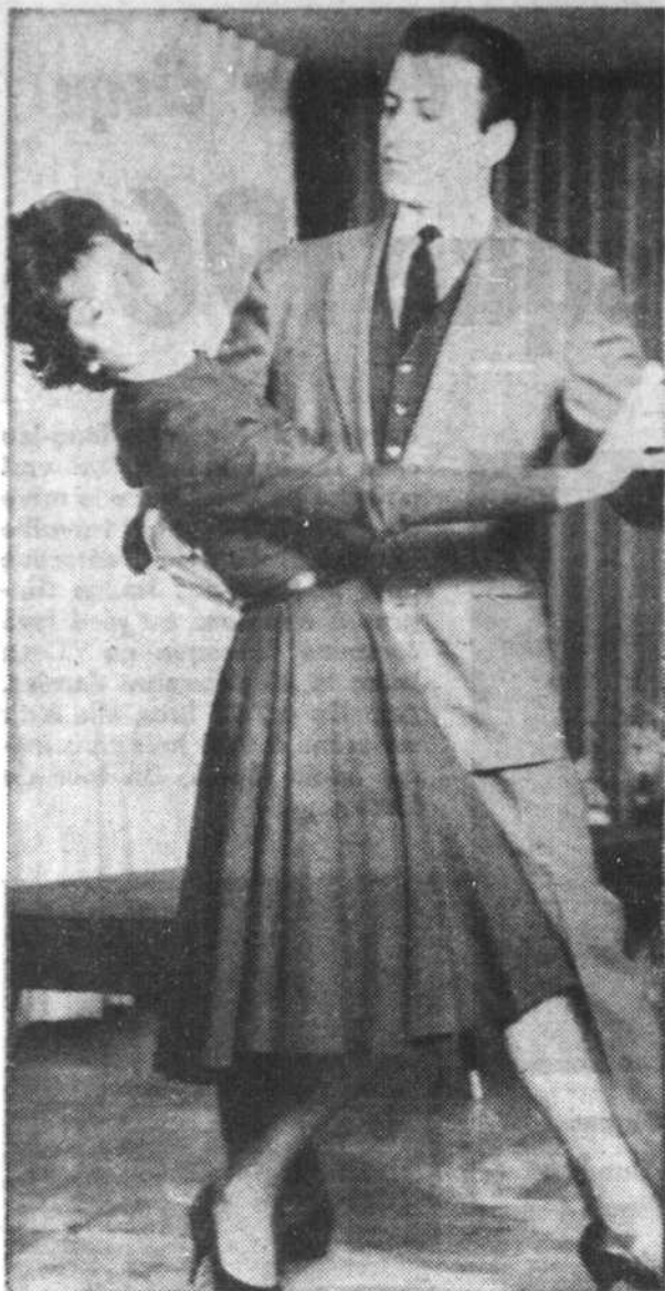
Un pas pour le photographe...