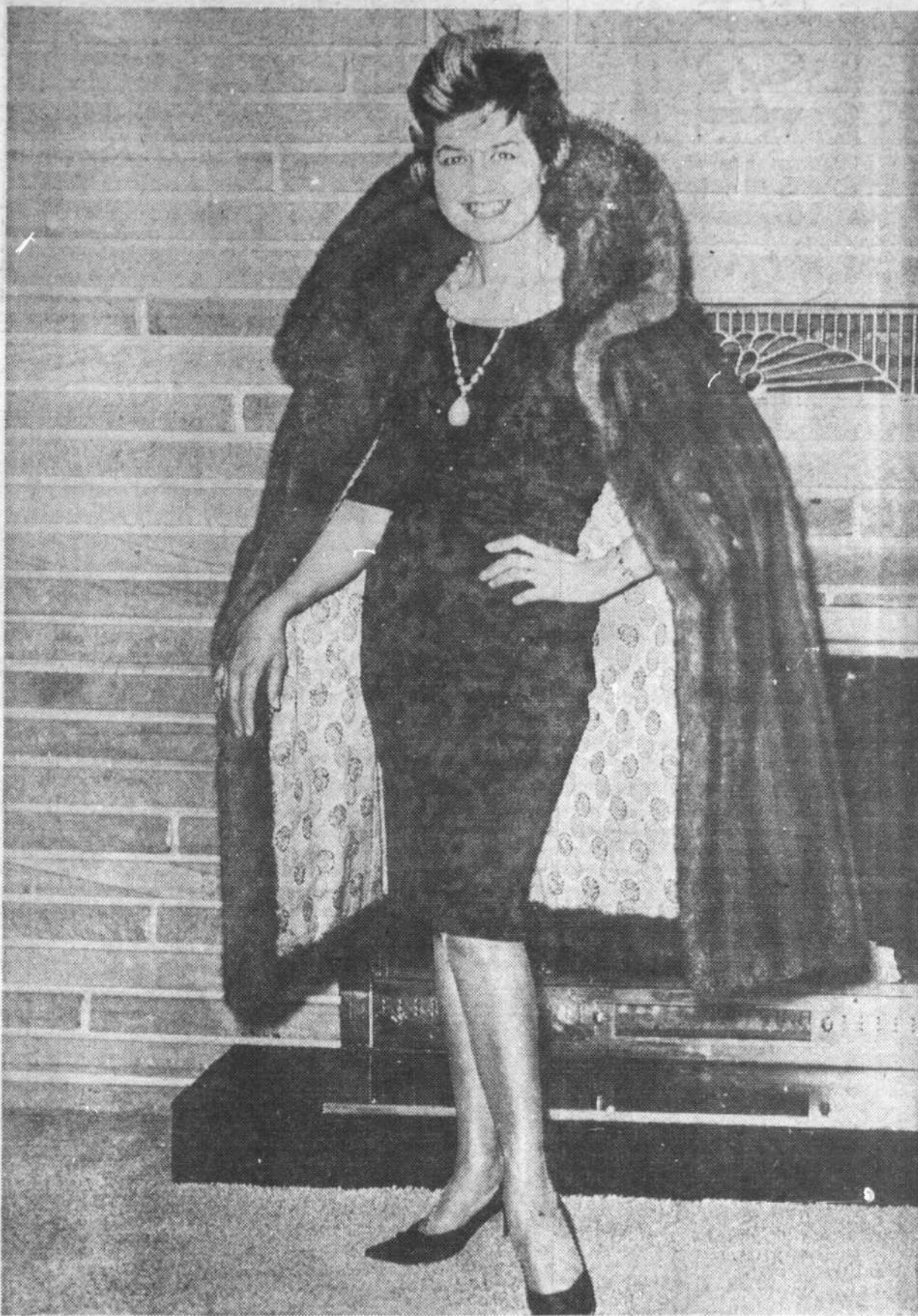
Elle l'essaie, bien sûr... "Dieu qu'il me va bien".

Le mari, bien sûr! Qui doit maintenant, en guise de cadeau de Noël... solder la facture!