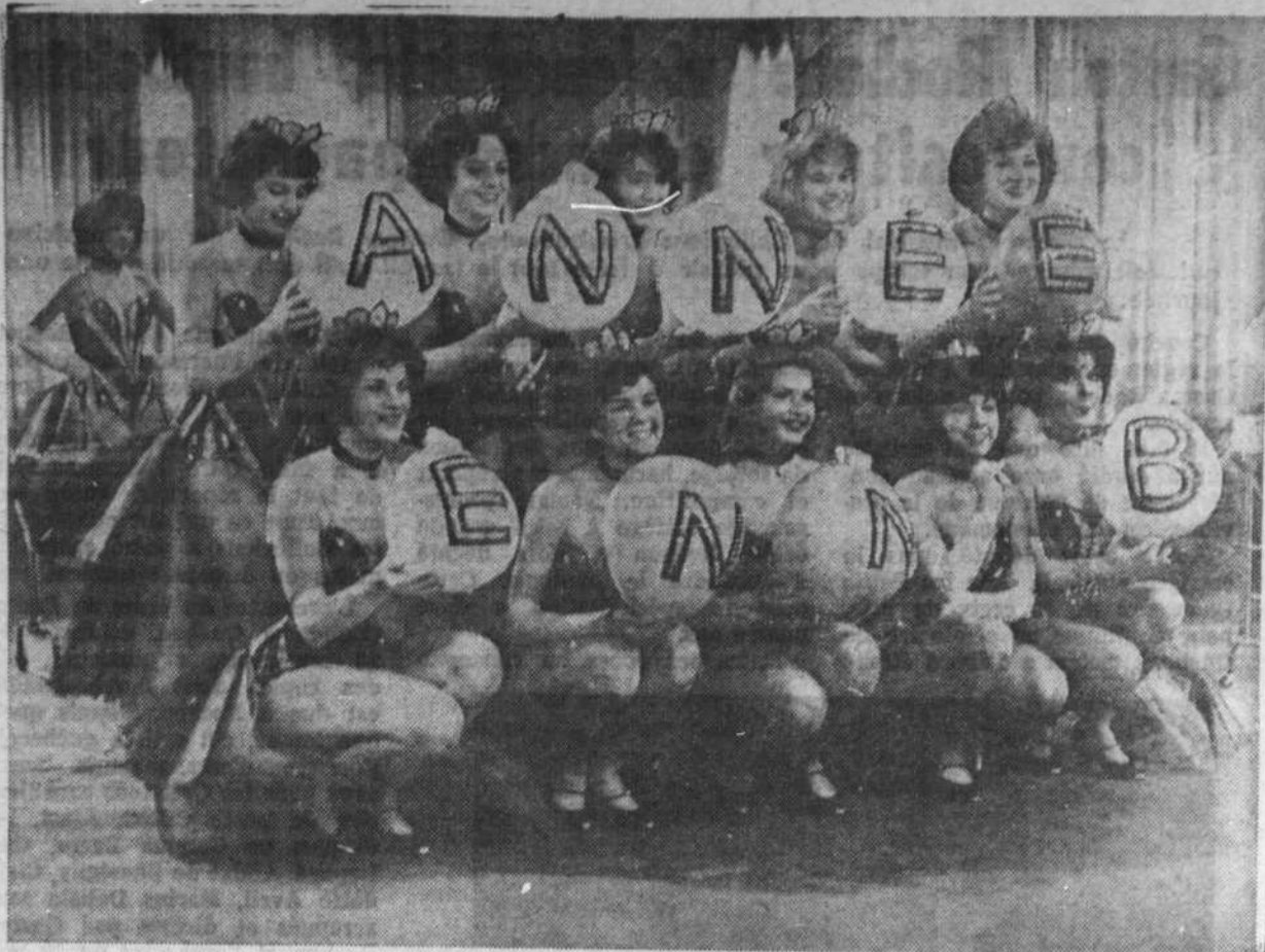
Voici les danseuses qui égayeront l'émission "Music-Hall" de dimanche dernier. Pour les lecteurs de "Radiomonde" — on demanda à notre photographe de les réunir dans l'ordre afin de former les mots BONNE ANNEE. Vous voyez le résultat: est-ce le pauvre orthographe ou les festivités du temps des Fêtes qui est la cause de ce jargon?... Nous ne le saurons probablement jamais. Tout de même, BONNE ANNEE A TOUS!