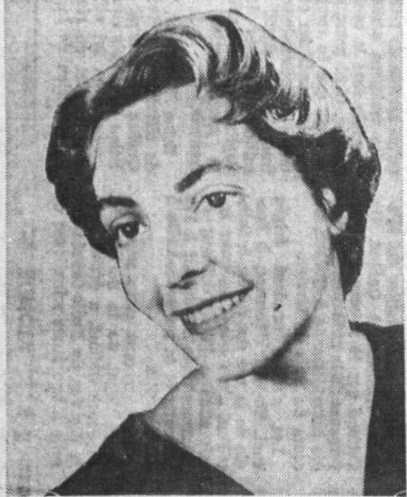
MISS RADIO-TV 1962