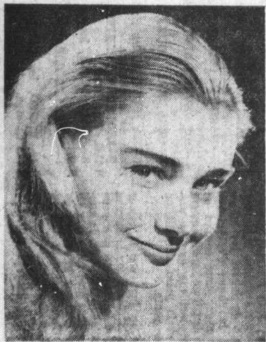
MISS RADIO-TV 1961