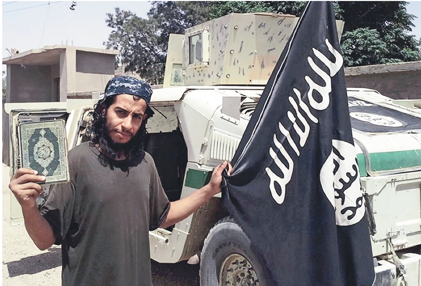
Abdelhamid Abaaoud, décrit comme l'architecte des attentats de Paris, a été tué par la police mercredi.