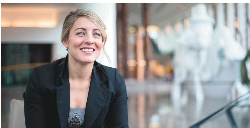
JAKE WRIGHT LE DEVOIR

Avis légaux..... B 4 Décès..... B 8 Météo..... B 9 Mots croisés..... B 3 Petites annonces..... B 8 Sudoku..... B 7