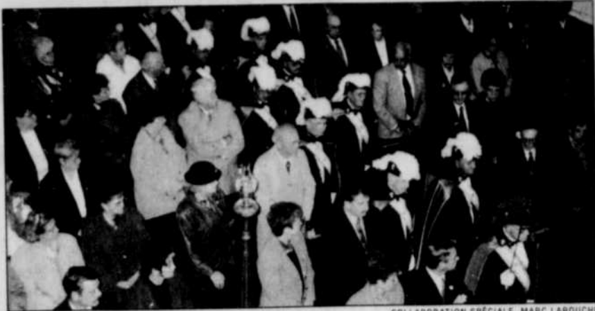
COLLABORATION SPÉCIALE MARC LAROCHE

Ces plaintes concernaient surtout les soins et services dispensés, l'accessibilité et la continuité des services et les relations interpersonnelles. 60 % des plaintes examinées visaient les centres hospitaliers.