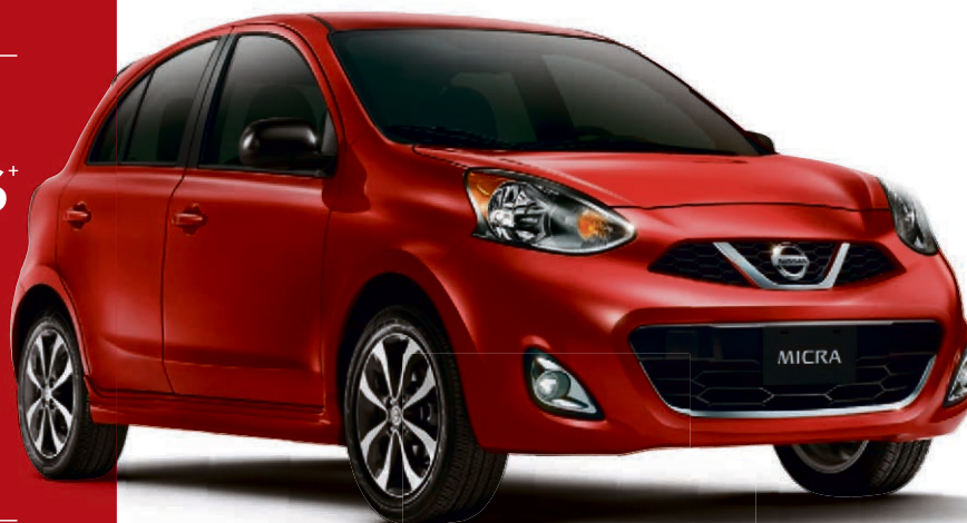
Micra 1.6 SR illustrée**

APPLICABLE LORSQUE FINANCÉ PAR NISSAN CANADA FINANCE SUR LES MODÈLES SV ET SR 2015