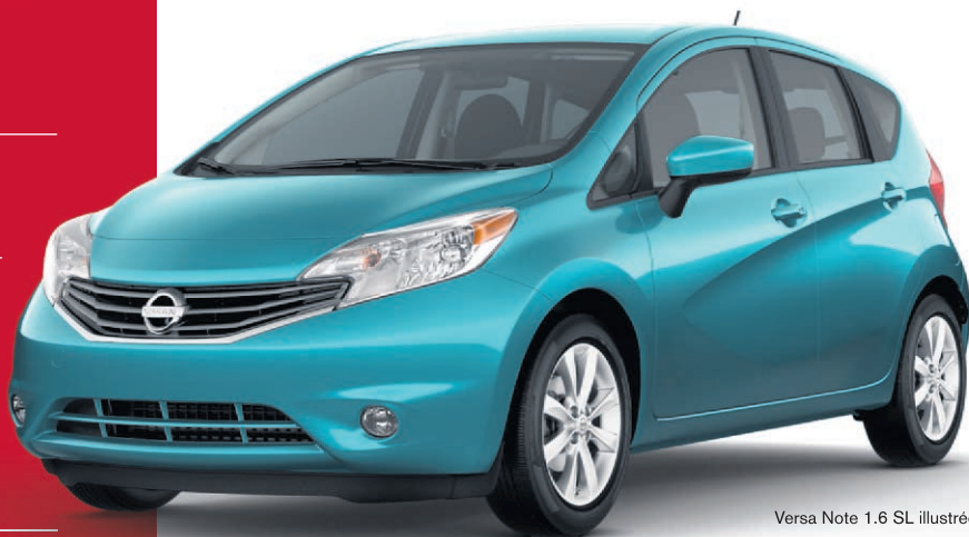
Versa Note 1.6 SL illustrée**

APPLICABLE LORSQUE FINANCÉ PAR NISSAN CANADA FINANCE SUR TOUS LES MODÈLES VERSA NOTE 2015