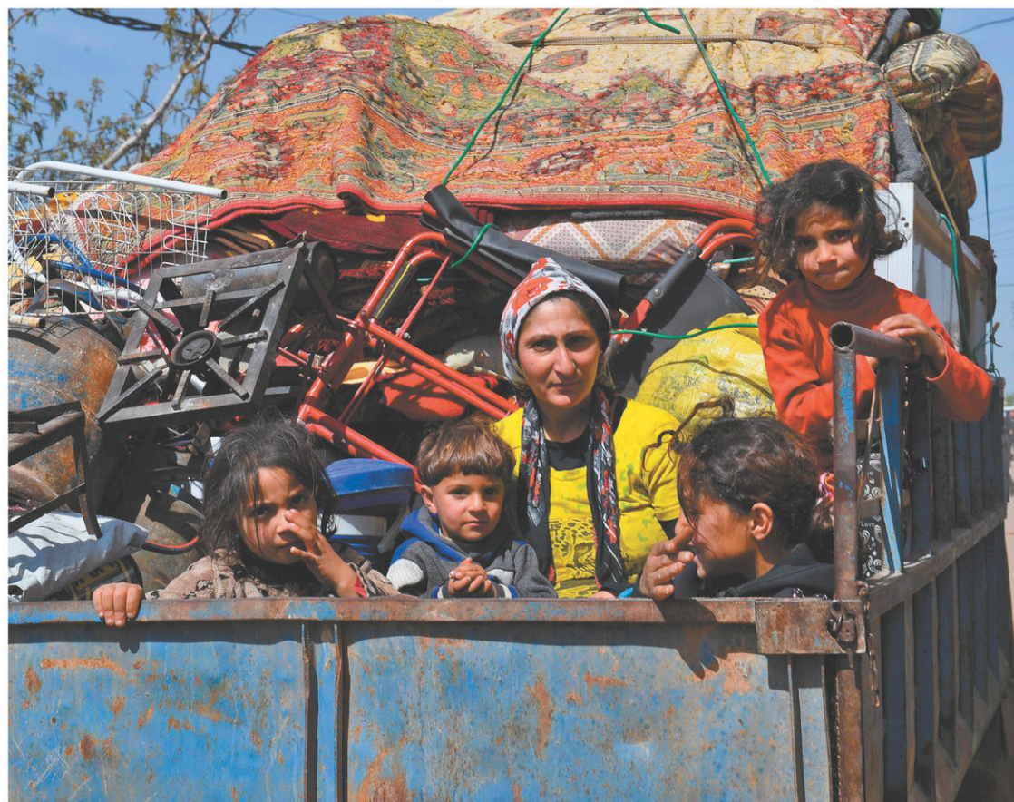
Une famille ayant quitté la ville d'Afrine est sur le point d'atteindre le village de az-Ziyarah.

Avec La Presse canadienne Agence France-Presse