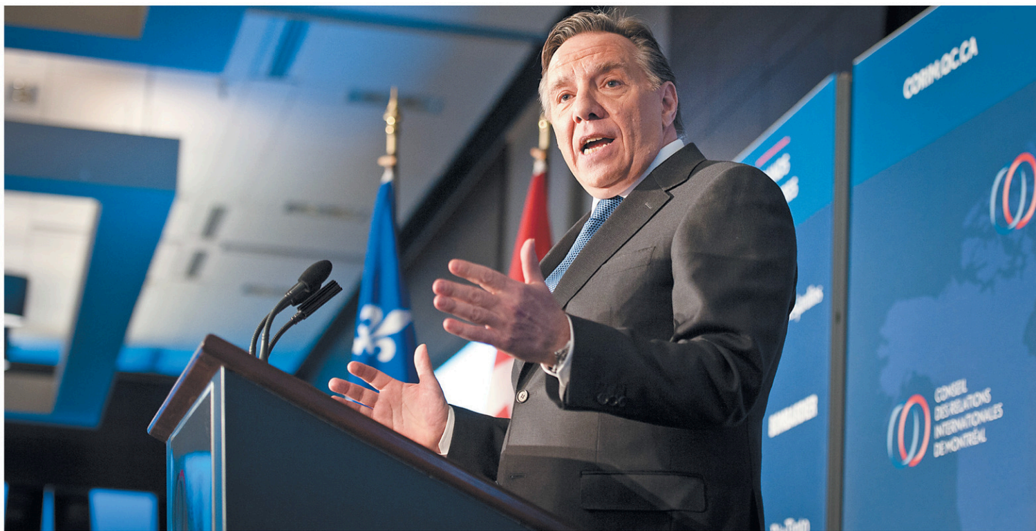
Le chef de la Coalition avenir Québec, François Legault, prenait la parole lundi lors d'un déjeuner-causerie organisé par le Conseil des relations internationales de Montréal.

M. Legault a aussi plaidé en faveur d'une «immigration réussie» — qui «correspond d'abord aux besoins de notre marché du travail» pour «ensuite les franciser» — pour pallier la pénurie de main-