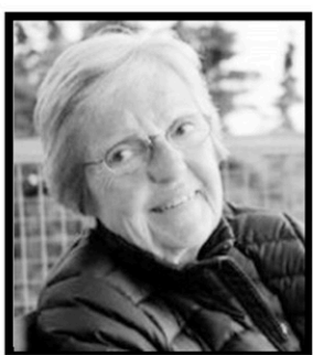
Mariette 20 mars 2017

Pour une publication section décès dans LE DEVOIR Le Mémorial 1895, rue Du Havre, bureau 107, Montréal QC H3K 2K4 Télé: 514 525-1149 514 525-9999 dore@memorial.com Par téléphone, télécopieur ou par courriel du lundi au vendredi de 10h30 à 18h30 Le samedi et dimanche de 12h00 à 17h30 Heure de service: 10h30