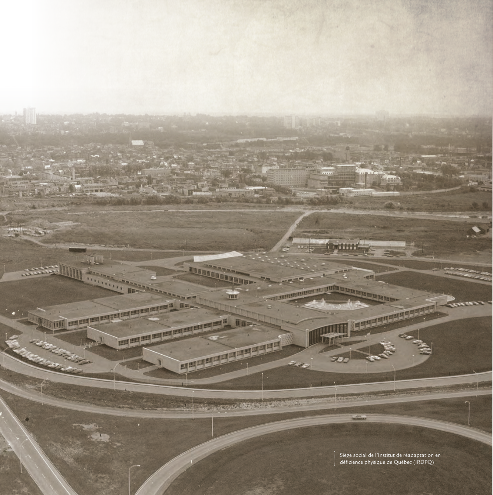
Siège social de l'Institut de réadaptation en déficience physique de Québec (IRDPO)