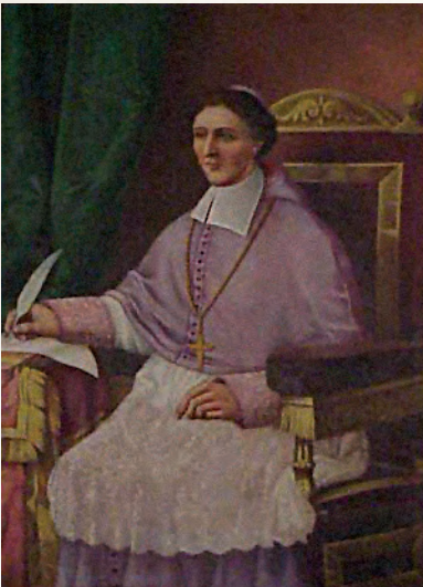
Mgr Jean-Baptiste de La Croix de Chevrières de Saint-Vallier Deuxième évêque de Québec