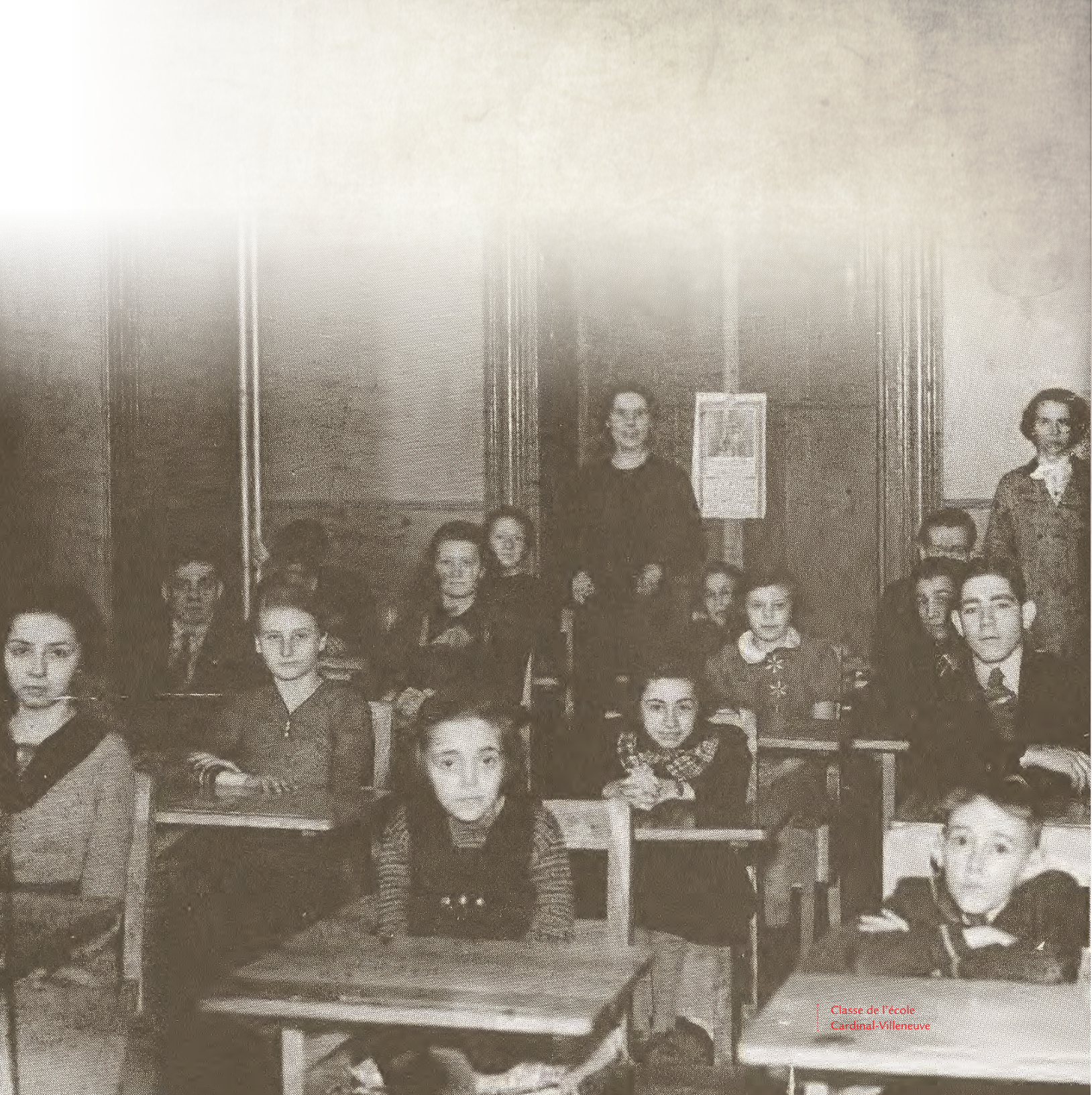
Classe de l'école Cardinal-Villeneuve