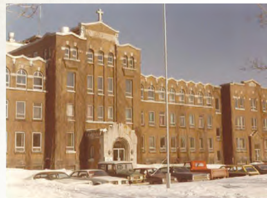
Institut Jean-Bosco Lieu des premières interventions de réadaptation en déficience visuelle

C'est en 1987 que le Centre Louis-Hébert intègre les locaux du 525, boulevard Wilfrid-Hamel, dans le même environnement que le Centre François-Charon. Environ 45 personnes y travaillent.