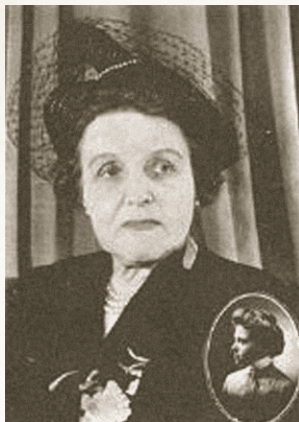
Dre Irma Levasseur Première femme médecin francophone du Québec Fondatrice de l'Hôpital de l'Enfant-Jésus Instigatrice du projet de création d'une institution pour les enfants « infirmes »