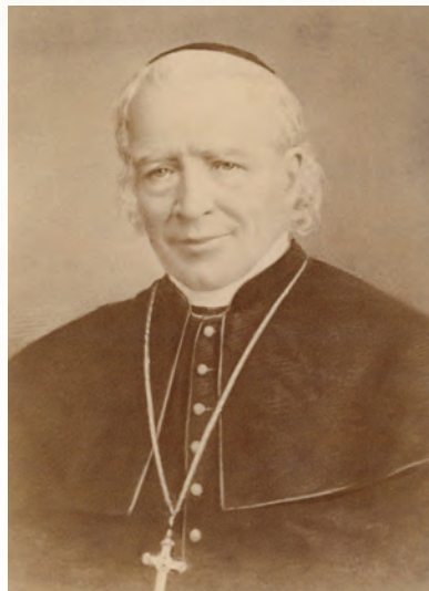
Mgr Ignace Bourget Évêque de Montréal