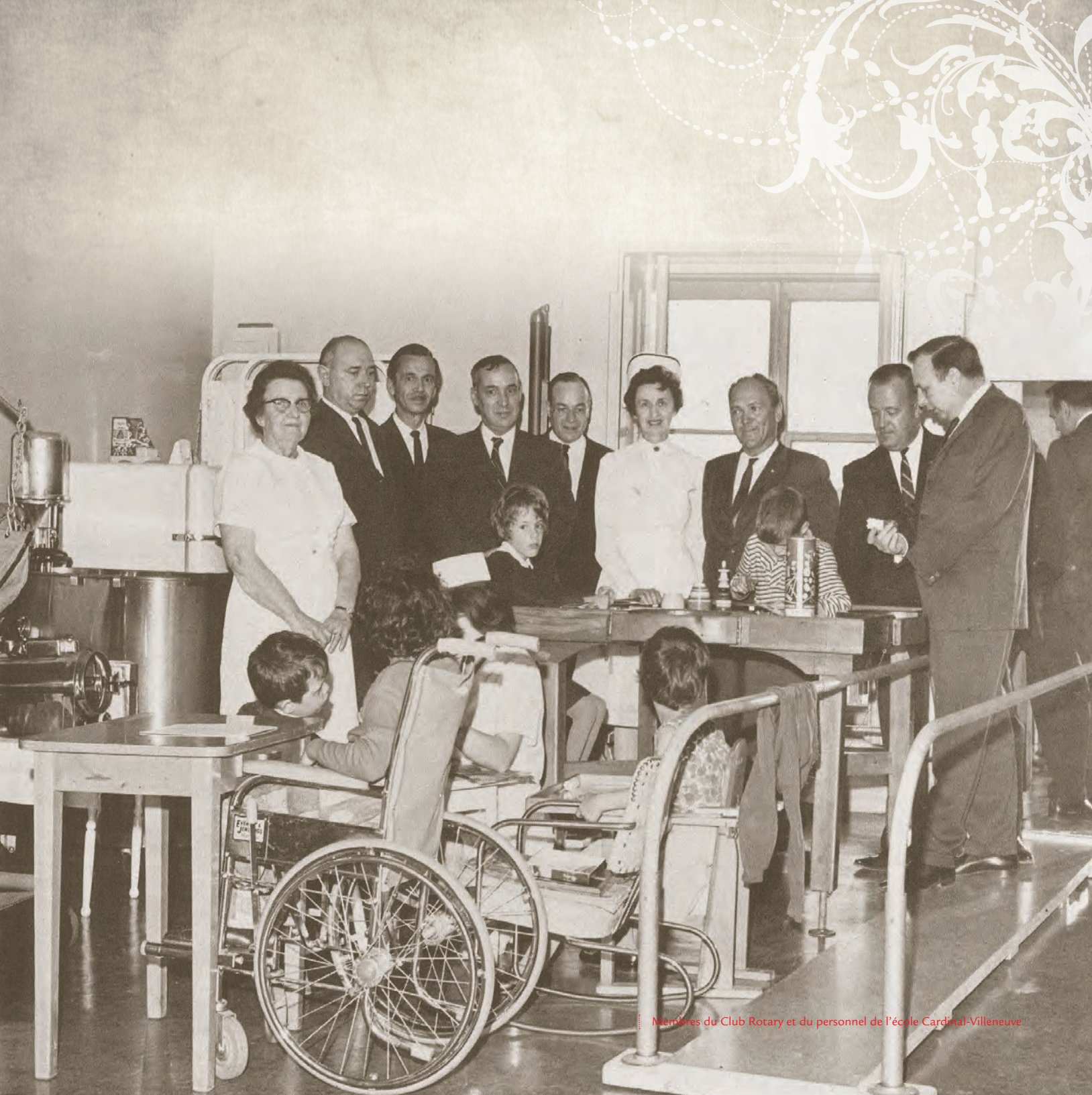
Membres du Club Rotary et du personnel de l'école Cardinal-Villeneuve