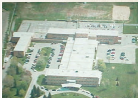
Vue aérienne du Centre Dominique-Tremblay (autrefois appelé Institut des Sourds de Charlesbourg) 775, rue Saint-Viateur