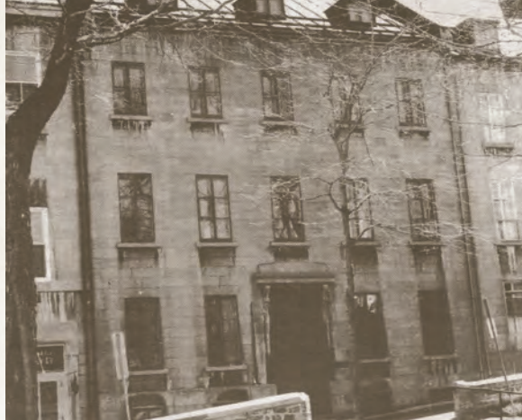
Édifice du 7, rue Sainte-Geneviève (Vieux-Québec) où logea l'école Cardinal-Villeneuve de 1938 à 1969.