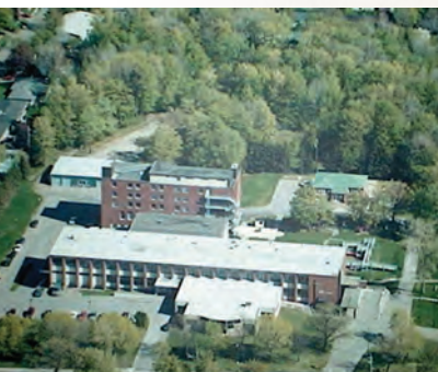
Vue aérienne du Centre Cardinal-Villeneuve 2975, chemin Saint-Louis