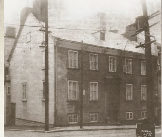
« Le Foyer », angle des rues Sainte-Ursule, Dauphine et Sainte-Angèle (Vieux-Québec)