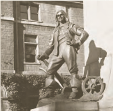
Monument Louis Hébert à Québec (Héménégilde Lavoie, 1942)