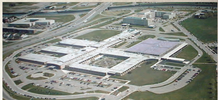
Vue aérienne du Centre François-Charon et du Centre Louis-Hébert 525, boulevard Wilfrid-Hamel