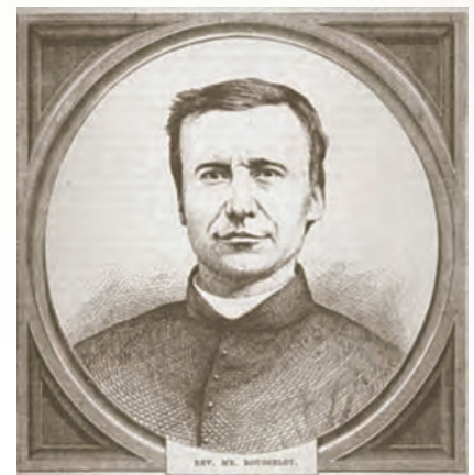
Abbé Benjamin-Victor Rousselot en 1873 Compagnie des prêtres de Saint-Sulpice Fondateur de l'Institut Nazareth

À Québec, des parents font pression sur la Commission scolaire régionale Jean-Talon qui met finalement sur pied, en 1965, un externat à l'intention des enfants atteints de cécité : à l'école Saint-Vincent pour le primaire et à la polyvalente de Charlesbourg pour le secondaire.