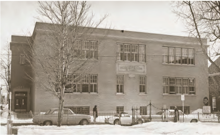
Édifice du 255, boulevard Saint-Cyrille ayant abrité l'école Saint-Georges – un établissement privé anglophone (aujourd'hui occupé par Loisirs Montcalm)