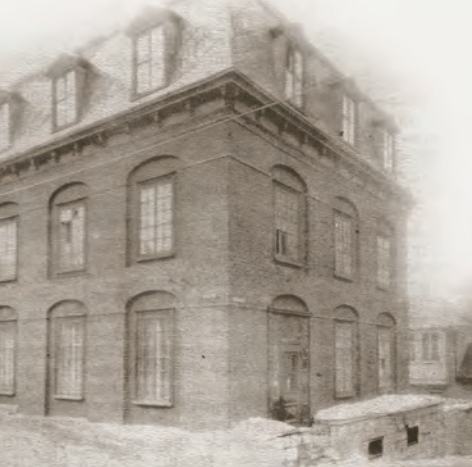
École Notre-Dame-de-Lourdes, devenue l'école Cardinal-Villeneuve en 1936 (quartier Saint-Jean-Baptiste à Québec)