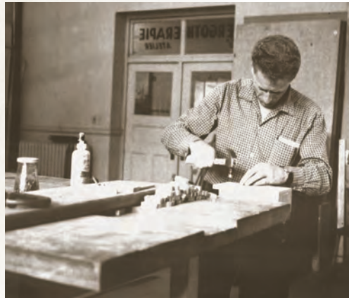
À l'intérieur de l'édifice du boulevard Saint-Cyrille

Les services externes de réadaptation sont par la suite déplacés au parc Victoria, dans les locaux de la Croix-Rouge appartenant à la congrégation des Augustines. Quelques années plus tard, cette clinique de réadaptation déménage à nouveau pour s'installer au 255, boulevard Saint-Cyrille, dans les locaux de l'école Saint-Georges (aujourd'hui Loisirs Montcalm).