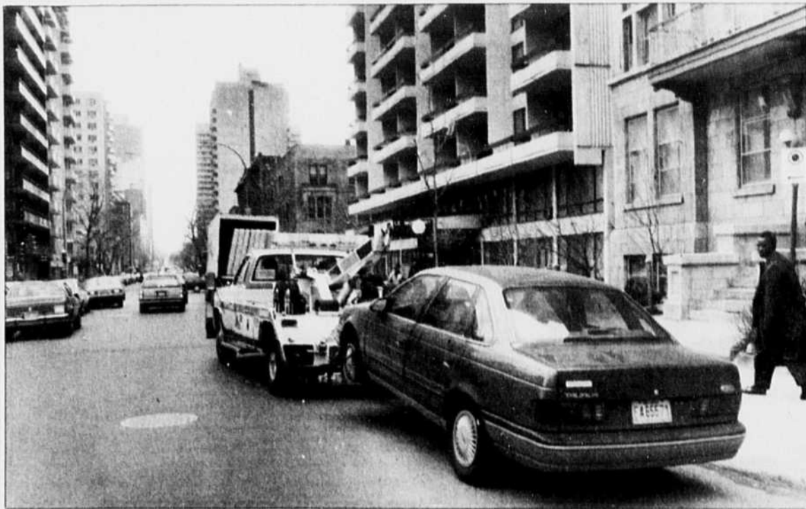
Première victime de l'opération-remorquage, hier, boulevard de Maisonneuve.