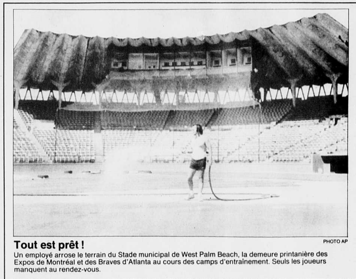
Tout est prêt ! Un employé arrose le terrain du Stade municipal de West Palm Beach, la demeure printanière des Expos de Montréal et des Braves d'Atlanta au cours des camps d'entraînement. Seuls les joueurs manquent au rendez-vous.

(PC) — Le défenseur Paul Coffey, des Penguins de Pittsburgh, a été proclamé le joueur par excellence du mois de février dans la Ligue nationale de hockey. En 14 rencontres, Coffey a amassé 28 points, dont six buts.