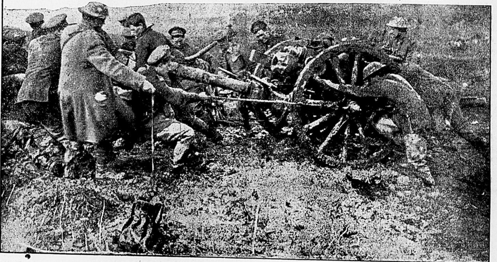
Artilleurs trainant leur pièce, lors de la récente avance britannique au front ouest.