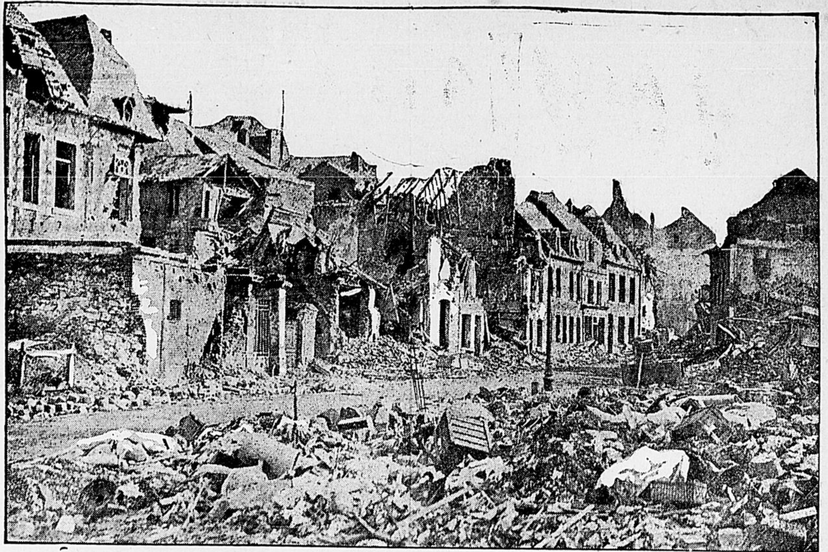
Une rue de Péronne, après l'évacuation allemande.