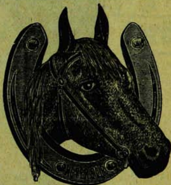
Un cheval ferré avec le fer NEVERSLIP est sûr de ne jamais glisser.

Heures de bureau : De 9 hrs a.m. à 9 hrs p.m.