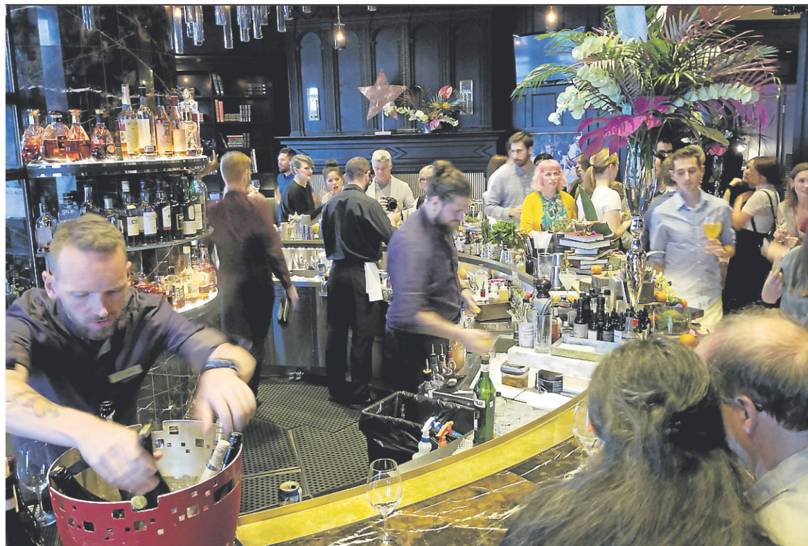
Assis au bar 1608, les visiteurs ont maintenant l'occasion d'échanger avec le personnel pour mettre en lumière l'art de la mixologie.