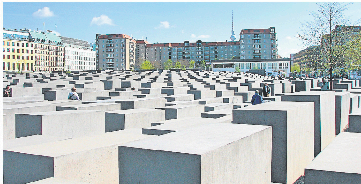
Des touristes n'hésitent plus à prendre des photos de mauvais goût au mémorial de l'Holocauste, à Berlin. L'artiste Shahak Shapira a d'ailleurs produit une série de photos choquantes pour dénoncer ce manque de sensibilité.

En mars, le compte Twitter du mémorial d'Auschwitz publiait un message pour inviter ses visiteurs à la décence. Utilisant les égoportraits de mauvais goût, le message rappelait que plus d'un million d'individus ont péri à Auschwitz. « Respectez leur mémoire. Il y a de meilleurs endroits pour apprendre à marcher en équilibre