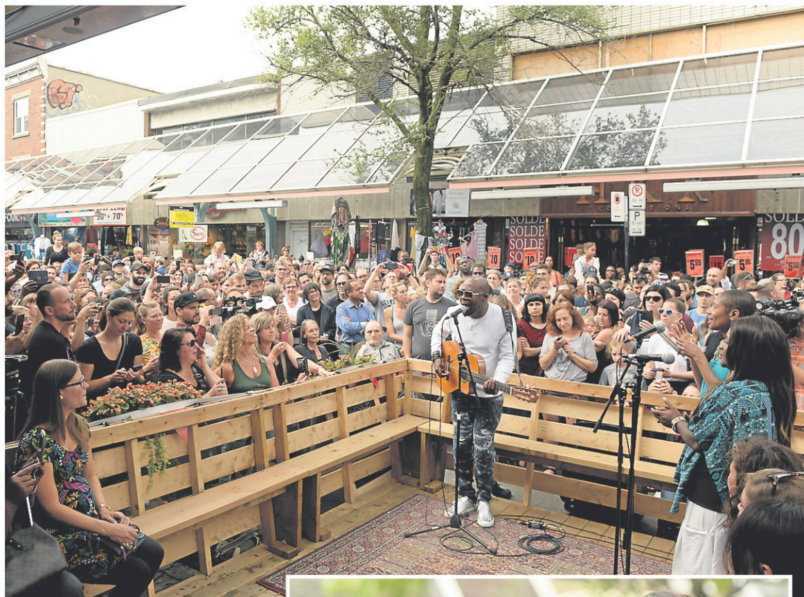
Le 18 août 2017, Wyclef Jean a donné une prestation surprise à la Plaza Saint-Hubert de Montréal, en compagnie de Mélanie Renaud et de Marie-Josée Lord.

amorcé cette conversation, mais les politiques judiciaires et carcérales restent très dures.