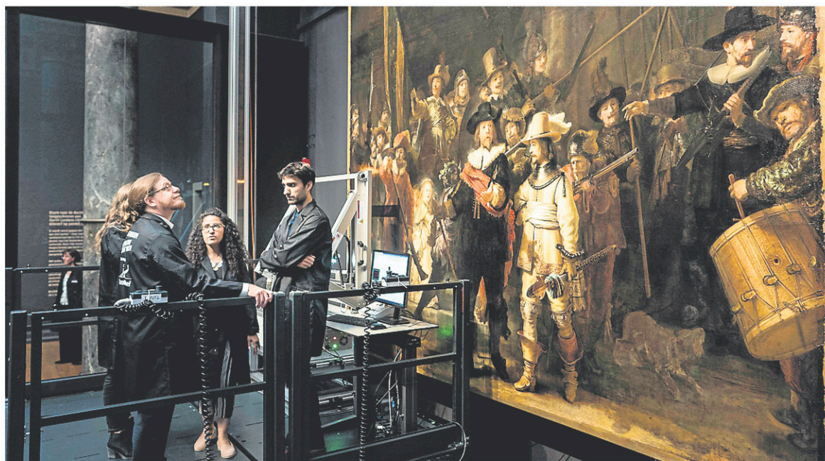
La Ronde de nuit de Rembrandt sera restaurée à la vue du grand public, dans la galerie d'honneur du Rijksmuseum d'Amsterdam.

Avant sa restauration, la Ronde de nuit a été le clou au printemps d'une exposition organisée pour le 350 e anniversaire de la mort du célèbre peintre néerlandais.