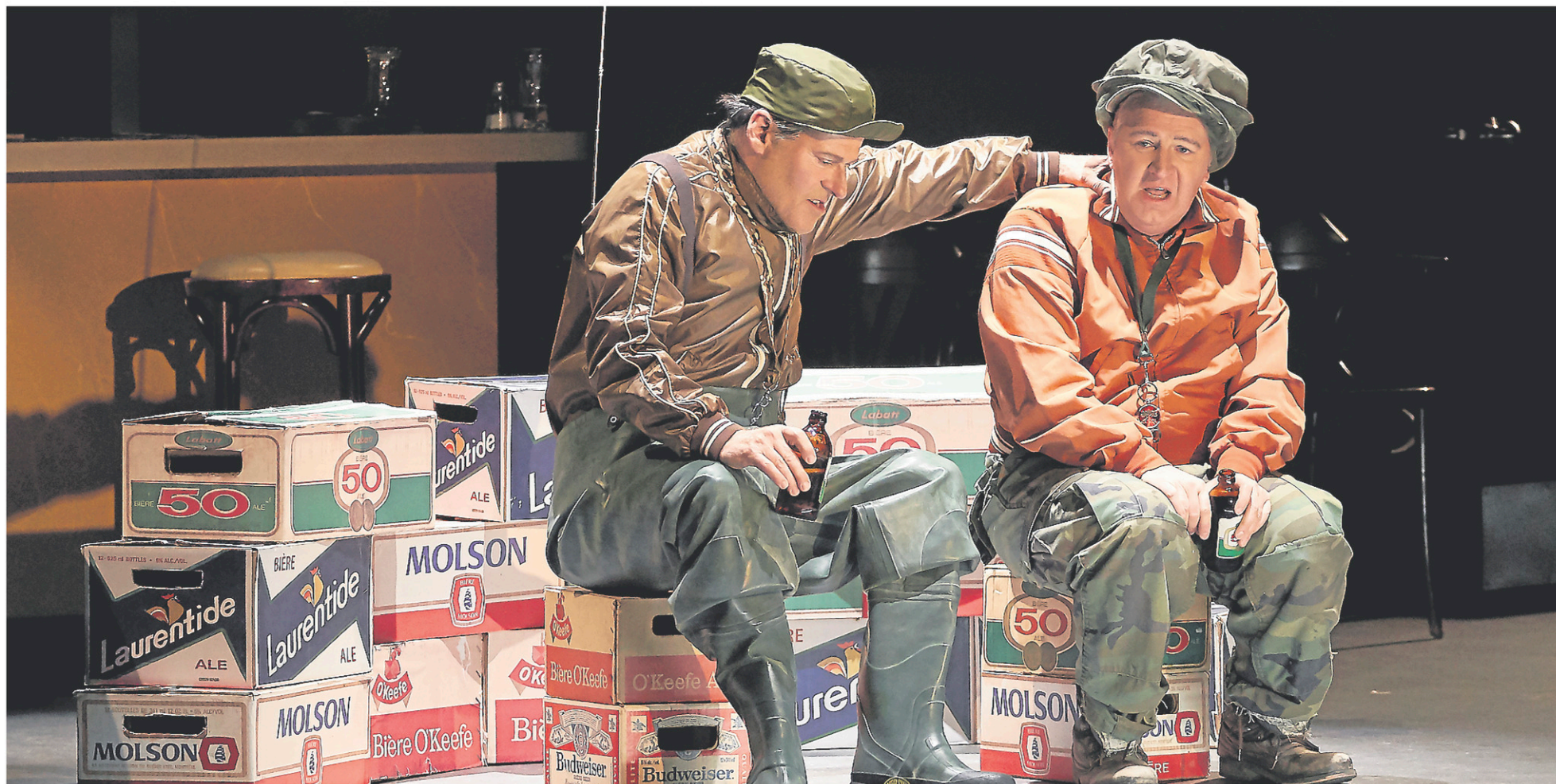
De nombreux éléments du décor de Broue font référence à la bière.