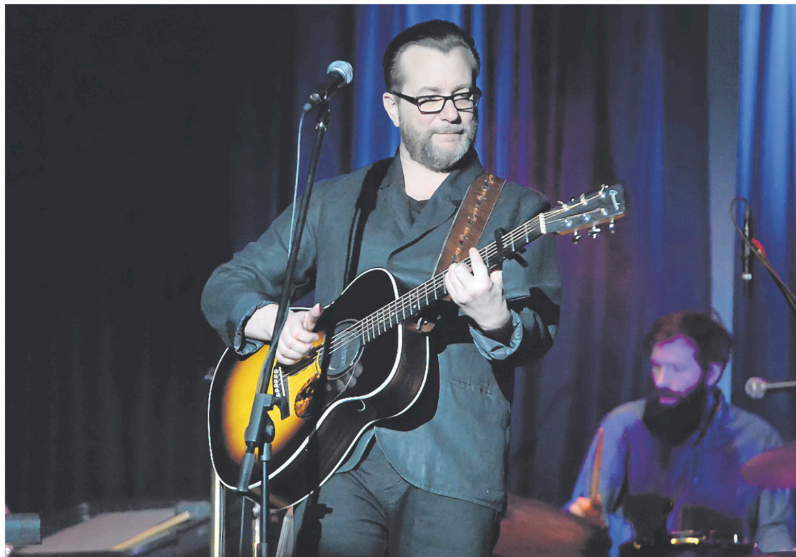
Luc de Larochellière propose un spectacle axé uniquement autour de son premier album Amère Amère, paru en 1988.

Pour lui, il s'agit d'une septième ou huitième participation au FEQ. Il a perdu le compte. « Les années avant 2000 ont été des années fastes pour moi, je suis venu pas mal souvent. Je me souviens d'être venu chanter avec Isabelle Boulay pour un show country et pour l'hommage à Richard Desjardins. »