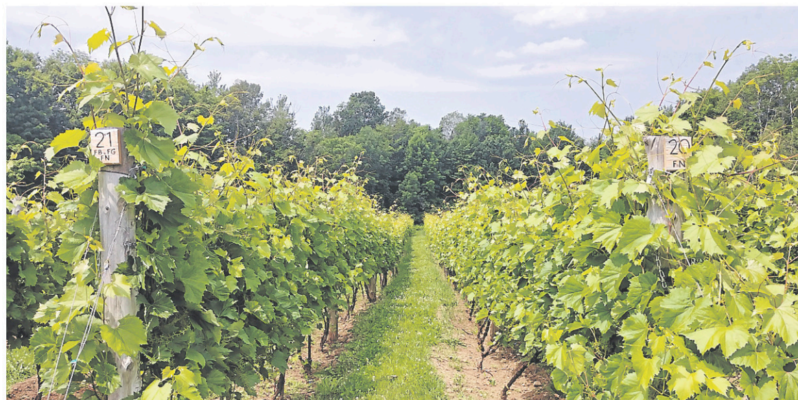
Malgré ses petites vrilles qui grimpent et s'accrochent, à ce stade, la vigne ressemble plus ou moins à une préado aux membres trop longs qui semble porter le poids du monde sur ses épaules.

not noir de tout acabit, que vous soyez partisans du nouveau ou de l'ancien, vous serez largement servis.