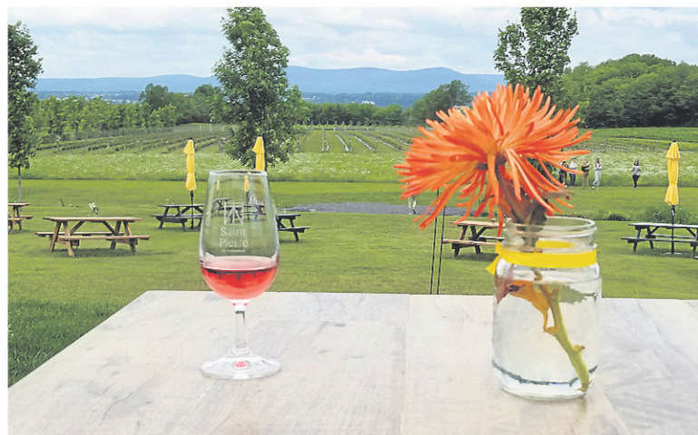
Saint Pierre Le Vignoble, bien situé sur l'île d'Orléans, fait parler de lui pour la qualité de ses produits.

Si c'est les pâtisseries qui vous allument, il faut se rendre dans un autre secteur de l'île, à Saint-Jean.