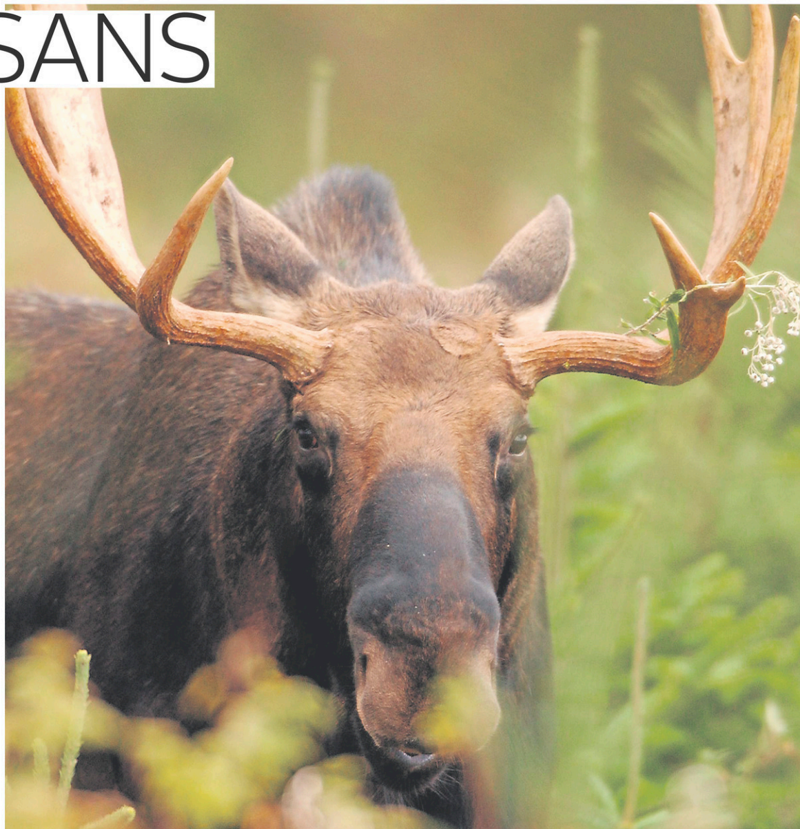
Si on veut faire de l'observation d'animaux sauvages, les employés des parcs s'avèrent de précieux alliés pour glaner de l'information.

« Il y a moins de monde sur les sentiers ou sur les lacs, il y a moins de maringouins. Mais il faut être bien habillé. »