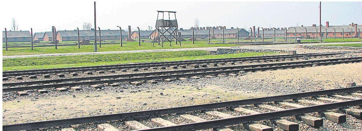
Les gestionnaires du site d'Auschwitz ont dû inviter leurs visiteurs, sur les médias sociaux, à faire preuve de retenue à l'intérieur des anciens camps de concentration.

Suivez mes aventures au www.jonathancusteau.com .