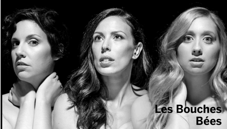
Les Bouches Bées

18 juillet, 17 h 30 – MÉLANE 19 juillet, 17 h 30 – LES BOUCHES BÉES 20 juillet, 17 h 30 – LA FINALE DE SLAM DU TREMPLIN