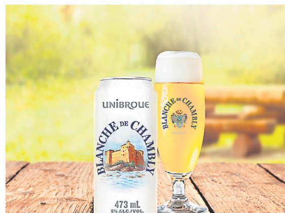
La Blanche de Chambly est maintenant disponible en canette.

Des experts et collectionneurs dans la salle?